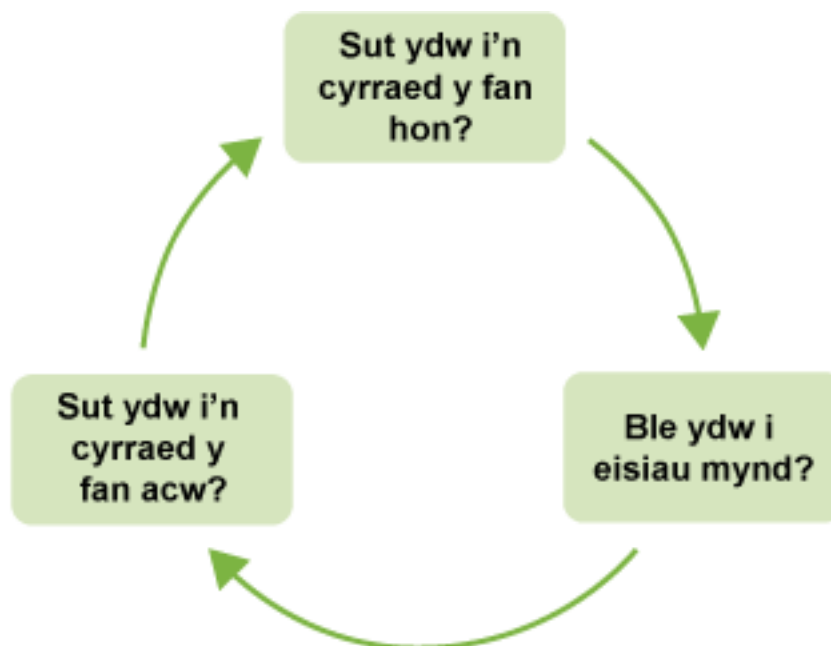
Ffigur 1 Y broses o gynllunio ar gyfer dyfodol gwell

Gellir ystyried y blociau yn broses barhaus sy'n cynnwys pwyso a mesur, archwilio cyfleoedd, pennu nodau a gweithredu (gweler Ffigur 1).