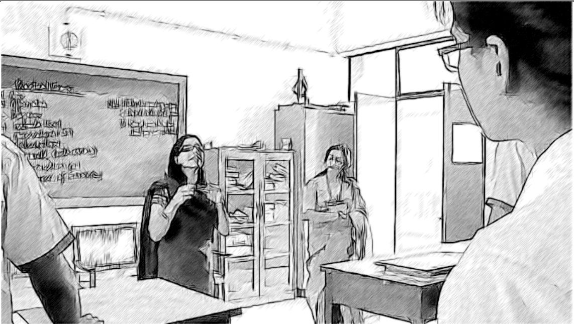
ಚಿತ್ರ 3 ಕಾರ್ಯ-ಸಂಬಂಧ ಆಧಾರಿತ ಶಾಲಾ ನಾಯಕರು

ನಾಯಕನಾಗಿ ನಿಮ್ಮ ಕಾರ್ಯ ವೈಖರಿ ಬಗ್ಗೆ ಮತ್ತೊಬ್ಬರಿಂದ ತಿಳಿದುಕೊಳ್ಳುವುದು (ಅದರ ಅನಿಸಿಕೆ ಅಭಿಪ್ರಾಯ) ಬಹಳ ಉತ್ತಮ ಇದರಿಂದ ನಿಮ್ಮ ಕಾರ್ಯಕ್ಷಮತೆ ವೃದ್ಧಿ ಆಗುವುದಲ್ಲದೇ ಉತ್ತಮ ಪರಿಣಾಮಕಾರಿ ಹಾಗೂ ಪ್ರಾಮಾಣಿಕ ಅಭಿಪ್ರಾಯಗಳನ್ನು ಕೊಡಲು ನಿಮಗೆ ಸಹಕಾರಿ ಆಗುತ್ತದೆ.