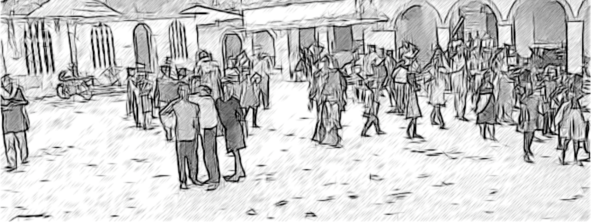
ಚಿತ್ರ 1 ಶಾಲೆಯ ಸಂಸ್ಕೃತಿ ಕಲಿಕೆಯನ್ನು ಪ್ರಭಾವಿಸಬಲ್ಲದು.

ಶಾಲಾ ಸಂಸ್ಕೃತಿಯನ್ನು “ಮುಚ್ಚಿಟ್ಟ ಪಠ್ಯಕ್ರಮ” ಎಂದು ಹೆಸರಿಸಲಾಗಿದೆ. ಈ ಸಂಸ್ಕೃತಿಯು ಶಾಲೆಯ ನಡವಳಿಗಳು ಪದ್ಧತಿಗಳು, ಸಂಸ್ಕಾರಗಳು, ಇತಿಹಾಸ, ಗುರುತು ಹಾಗೂ ಶಬ್ದಭಂಡಾರವನ್ನು ಸಿದ್ಧಗೊಳಿಸುತ್ತವೆ. ವಿದ್ಯಾರ್ಥಿಗಳು ಅನಾಯಾಸವಾಗಿ ತಮಗೆ ಗೊತ್ತಾಗದಂತೆಯೆ ನಡವಳಿಕೆಯ ನೀತಿಗಳನ್ನು ಮತ್ತು ಶಾಲಾ ಸಂಸ್ಕೃತಿಯ ಅಪೇಕ್ಷೆಗಳನ್ನು ಕಲಿಯುತ್ತಾರೆ, ಮತ್ತು ಇದು ಅವರ ಕಲಿಕೆಯನ್ನು ಸಹ ಪ್ರಭಾವಗೊಳಿಸುತ್ತದೆ.