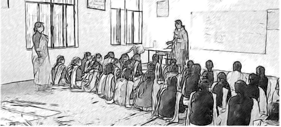
ಚಿತ್ರ 4 ಉತ್ತಮಪಡಿಸಬೇಕಾದ ಅಂಶಗಳನ್ನು ಗುರುತಿಸಲು ತಂಡದೊಂದಿಗೆ ಕಾರ್ಯವನ್ನು ನಿರ್ವಹಿಸುವುದು

ಶಾಲೆಗಳು ಹಿಮ್ಮಾಹಿತಿ ನೀಡಬಲ್ಲ ಪರಿಸರವನ್ನು ನಿರ್ಮಾಣ ಮಾಡುವಲ್ಲಿನ ಸಾಧನೆಯೆಡೆಗಿನ ಚಲನೆಯನ್ನು ಮೌಲ್ಯಮಾಪನ ಮಾಡಲು ಬಯಸಬಹುದು. ನಿಮ್ಮ ಶಾಲೆಯಲ್ಲಿ ಶಿಕ್ಷಕರು ತಮ್ಮ ಬೋಧನೆಯನ್ನು ಉತ್ತಮಪಡಿಸಿಕೊಳ್ಳಲು ಒಂದು ಉತ್ತಮ ಸ್ಥಳ ಎಂದು ನಿಮಗನ್ನಿಸಿದರೆ, ಉಳಿದ ಶಿಕ್ಷಕರು ಸಹ ಇದೇ ರೀತಿಯ ಅಭಿಪ್ರಾಯವನ್ನು ಹೊಂದಿದ್ದಾರೆಯೇ ಎಂಬುದನ್ನು ತಿಳಿಯಲು ಇದು ಸುಸಮಯ. ಇದರೊಂದಿಗೆ ನಿಮ್ಮ ವಿದ್ಯಾರ್ಥಿಗಳೂ ಸಹ ಇಲ್ಲಿ ಅವರು ತಿಳಿಯಬೇಕಾದ ಅಂಶಗಳನ್ನು ಕಲಿಯುವ, ಮತ್ತು ಆತ್ಮವಿಶ್ವಾಸವನ್ನು ಬೆಳೆಸುವ ರೀತಿಯಲ್ಲಿರುವುದರಿಂದ ತರಗತಿಯಲ್ಲಿ ಭಾಗವಹಿಸಲು ಇಷ್ಟಪಡುತ್ತಾರೆಯೇ ಎಂಬುದನ್ನು ಮತ್ತು ಪೋಷಕರು ತಮ್ಮ ಮಕ್ಕಳು ಕಲಿಯುತ್ತಿರುವ ರೀತಿಯನ್ನು ಒಪ್ಪುತ್ತಾರೆಯೇ ಎಂಬುದನ್ನು ನೀವು ಅನ್ವೇಷಿಸಬೇಕಾದುದು ಮಹತ್ವದ್ದಾಗಿದೆ.