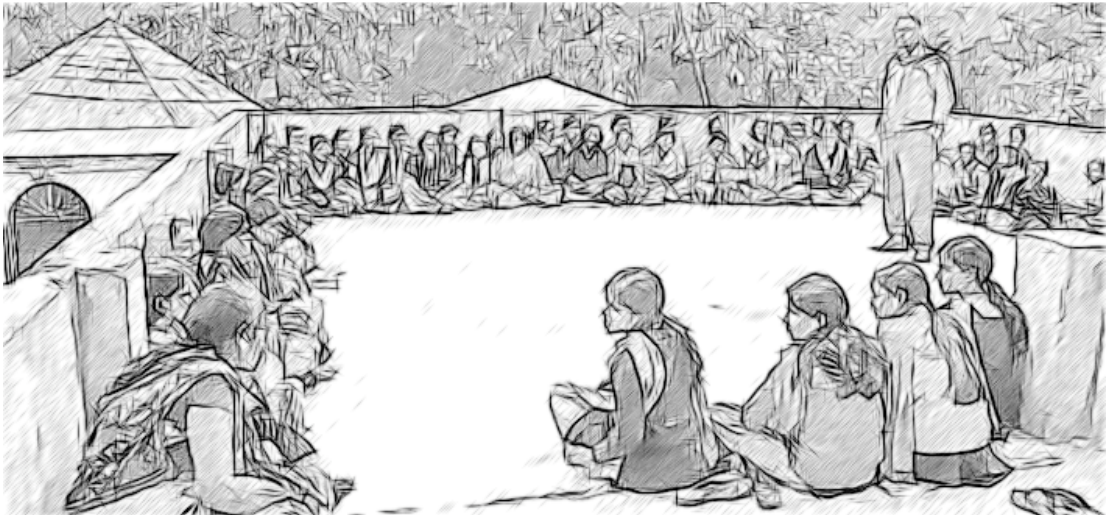
ಚಿತ್ರ 2 ನಿಮ್ಮ ಶಾಲೆಯು ಧನಾತ್ಮಕ ಶಾಲಾ ಸಂಸ್ಕೃತಿಯನ್ನು ಹೊಂದಿದೆಯೇ