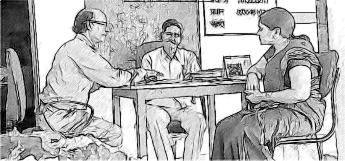
ಚಿತ್ರ 5 ಒಂದು ಧನಾತ್ಮಕ ಶಾಲಾ ಸಂಸ್ಕೃತಿಗೆ ಕ್ರಿಯಾ ಯೋಜನೆಯ ಅಗತ್ಯವಿದೆ.

ನಿಮ್ಮ ಶಾಲೆಯ ಸಂಸ್ಕೃತಿಗೆ ಪ್ರಾಧಾನ್ಯತೆ ನೀಡಲು ಆಗುವಂತಹ ಹೆಚ್ಚಿನ ಸಾಕ್ಷಾಧಾರಗಳನ್ನು ಈಗಾಗಲೇ ನೀವು ಸಂಗ್ರಹಿಸಿಟ್ಟುಕೊಂಡಿರುವಿರಿ. ಇದು ಶಾಲಾ ಸಂಸ್ಕೃತಿಯ ಗುಣ ಲಕ್ಷಣಗಳ ಬಗ್ಗೆ (ಚಟುವಟಿಕೆ 1-3), ಶಾಲೆಯ ಸುತ್ತಲಿನ ವರ್ತನೆ ಮತ್ತು ಕ್ರಿಯೆಗಳನ್ನು ಅವಲೋಕಿಸುವುದು (ಚಟುವಟಿಕೆ-4), ನೀವು ಕಾರ್ಯನಿರ್ವಹಿಸುತ್ತಿರುವ ತಂಡದ ದೃಷ್ಟಿಕೋನಗಳ ಬಗ್ಗೆ (ಚಟುವಟಿಕೆ 5) ಮತ್ತು ಇತರ ಭಾಗೀದಾರರ ಅಭಿಪ್ರಾಯಗಳ ಬಗೆಗಿನ ನಿಮ್ಮ ಆಲೋಚನೆಗಳನ್ನೂ ಸಹ ಒಳಗೊಂಡಿದೆ.