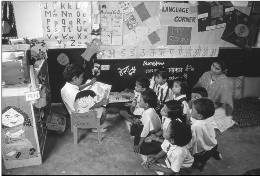
चित्र 3: एक छात्र अन्य छात्र-छात्राओं और शिक्षक को एक कहानी पढ़कर सुनाता है।

अब एक छात्र को बुलाएँ और उसे शेष कक्षा को कहानी सुनाने को कहें (चित्र 3)। छात्र को पुस्तक पकड़ने दें और शिक्षक की तरह अभिनय करने दें। हो सकता है कि छात्र ने पाठ्य-सामग्री का कुछ भाग या पूरी सामग्री याद कर ली हो, इसमें कोई हर्ज नहीं है – छात्र को आपकी अभिव्यक्ति और उत्साह की नकल करने दें। अन्य छात्र-छात्राओं के साथ बैठें और उन्हें दिखाएँ कि एक अच्छा श्रोता कैसा होना चाहिए। यदि पठन में कोई सामूहिक भाग भी है, तो इसमें छात्र-छात्राओं के साथ शामिल हों।