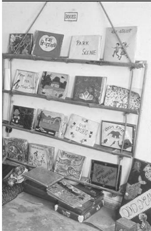
चित्र 2: कक्षा में पुस्तकों वाले हिस्से का एक उदाहरण।

अन्य शिक्षकों से इस बारे में बात करें कि किस तरह आप लोग साथ मिलकर पठन के लिए साझा संसाधन बना सकते हैं।