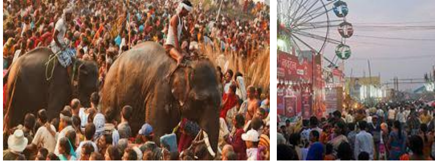
चित्र 1: सोनपुर मेला, बिहार

बिहार का सोनपुर (हरिहर क्षेत्र) मेला एशिया का सबसे बड़ा पशु मेला है। मेला के दौरान यह हमेशा भीड़ से भरा रहता है। कामकाज के समय यहाँ अत्यन्त गतिशील वातावरण रहता है। सुबह से लेकर शाम तक जितनी तेज़ी से यहाँ वातावरण बदलता है उससे एक हॉकर से लेकर कार पार्किंग या दुकान में कर्मचारियों की संख्या, सर्कस/नौटंकी देखने वाली भीड़ तक सभी कुछ प्रभावित होता है। वातावरण में इस बदलाव को गतिविधि कहा जाता है।