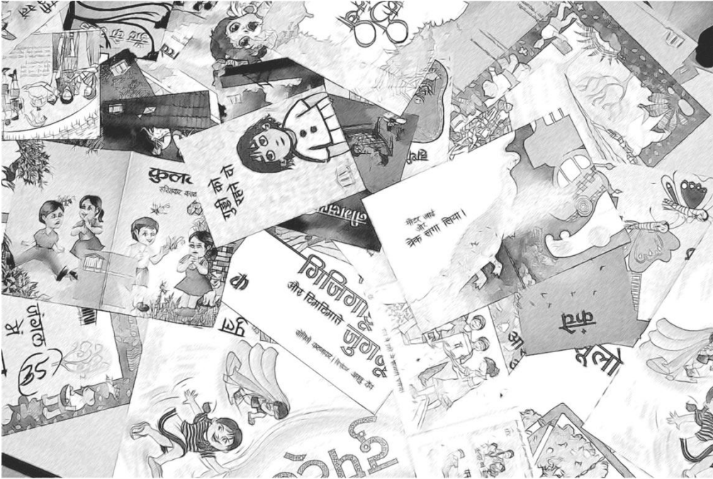
चित्र 2 पठन कोने में मौजूद विभिन्न प्रकार की पठन सामग्री।

उन भाषाओं में पुस्तकों, पत्रिकाओं, लघुपत्रों और अन्य पठन सामग्री का संग्रह प्रारंभ करें, जिन्हें आपके विद्यार्थी बोलते हैं और इन आइटमों को अपने पठन कोने में शामिल कर दें (चित्र 2)।