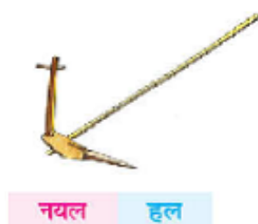
चित्र 1 हल। यह

मेरे अधिकांश विद्यार्थी हो भाषा बोलते हैं और जब वे पहली बार इस स्कूल में आए, तो उन्हें हिंदी के बहुत कम शब्दों के बारे में पता था। मैंने देखा कि कुछ विद्यार्थी कक्षा की दीवार पर लगे हिंदी वर्णमाला चार्ट में दिए गए चित्रों द्वारा दर्शाए गए शब्दों को गलत तरीके से बता रहे थे। उन्होंने 'हल' ('हल' के लिए हिंदी भाषा का शब्द) की बजाय 'नायल' ('हल' के लिए हो भाषा का शब्द) कहा। जब मैंने उनसे पूछा कि यह कौन सा अक्षर है, तो विद्यार्थियों ने मुझसे कहा कि यह 'न' है, जो कि 'हल' के लिए हिंदी भाषा के पहले अक्षर 'ह' की बजाय हो भाषा में 'हल' का पहला अक्षर था।