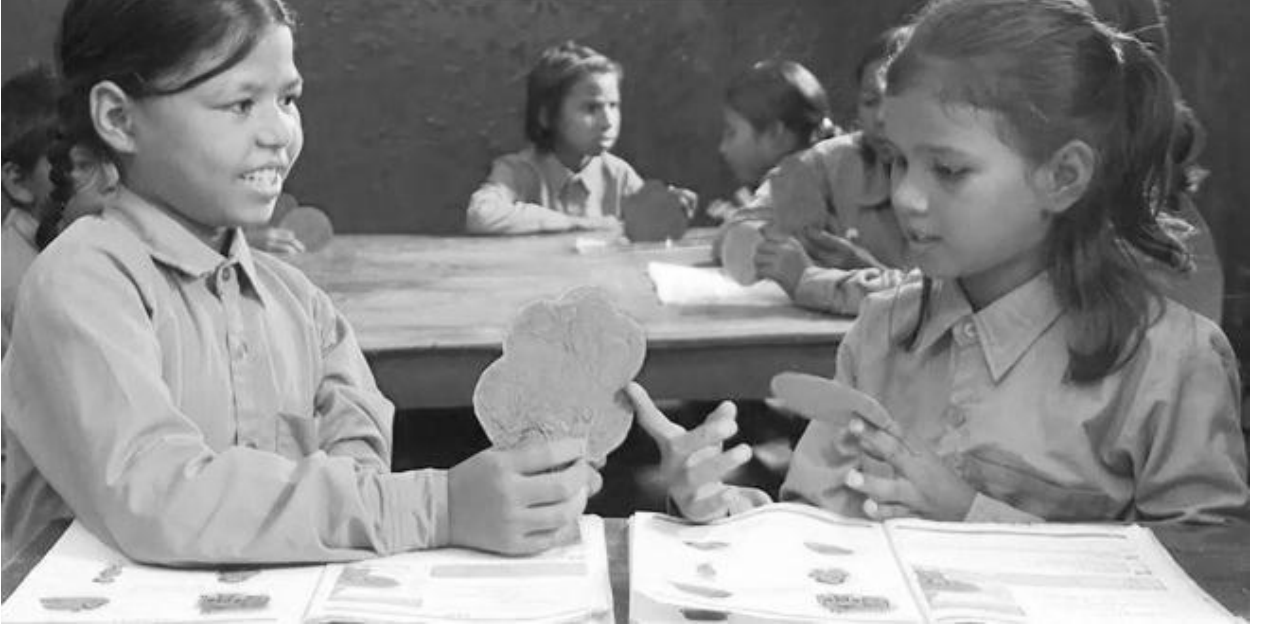
चित्र 3 विद्यार्थी अपनी मातृभाषा का उपयोग करके जोड़ों में किसी विषय की चर्चा करते हैं।