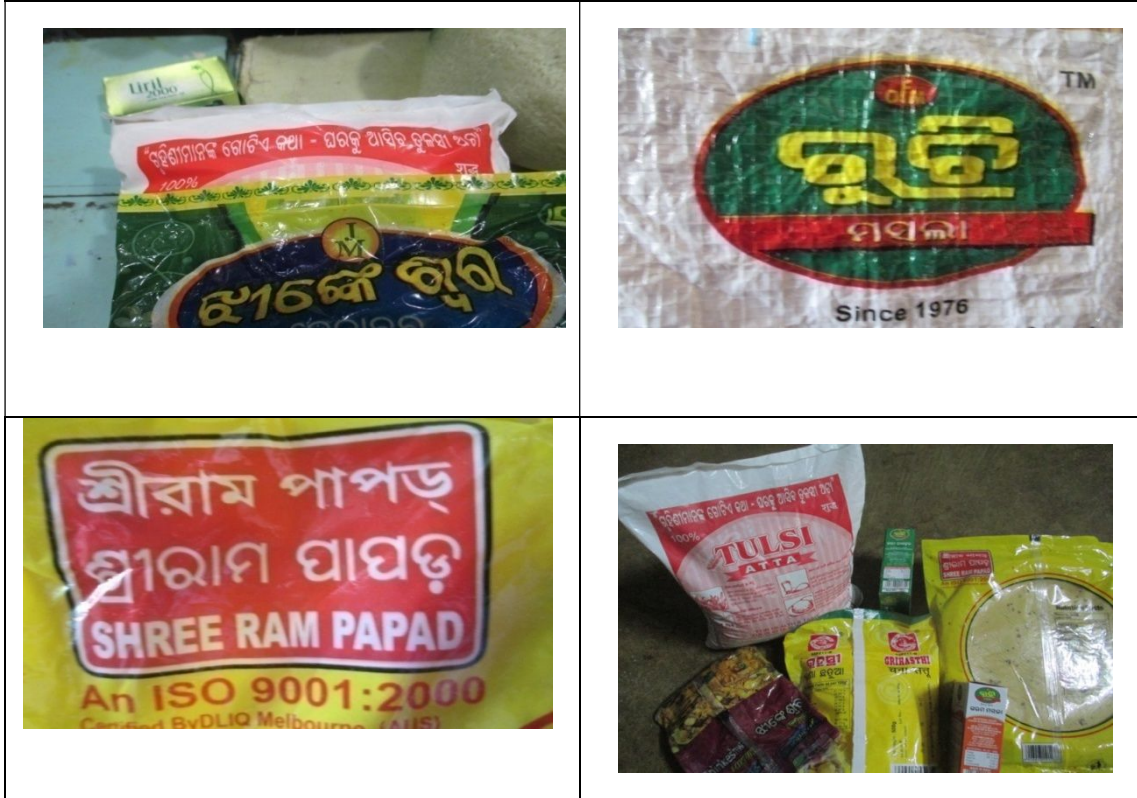
ଚିତ୍ର-୧ ଖାଦ୍ୟ ପ୍ୟାକେଟ୍ ଉପରେ ଲେଖାର ଉଦାହରଣ ।

ତେଣୁ ମୁଁ ବିଭିନ୍ନ ପ୍ରକାର ଖାଲି ସଫା ଖାଦ୍ୟ ପ୍ୟାକେଟ୍, କାଗଜ ପେଟି, ଥଳା ସଂଗ୍ରହ କରିବାକୁ ଆରମ୍ଭ କଲି ଓ ମୋ ପାଇଁ ସେମାନଙ୍କର ଏହି ସବୁକୁ ସଂଗ୍ରହ କରି ରଖିବା ପାଇଁ ମୋ ସଂପର୍କୀୟ ଓ ପଡ଼ୋଶୀମାନଙ୍କୁ କହିଲି। ଅନେକ ପ୍ୟାକେଟ୍ ସୁନ୍ଦର ଶବ୍ଦ, ବାକ୍ୟାଂଶ ଓ ଚିତ୍ରଗୁଡ଼ିକରେ ବର୍ଣ୍ଣିତ ହୋଇଥିଲା (ଚିତ୍ର-୧) ।