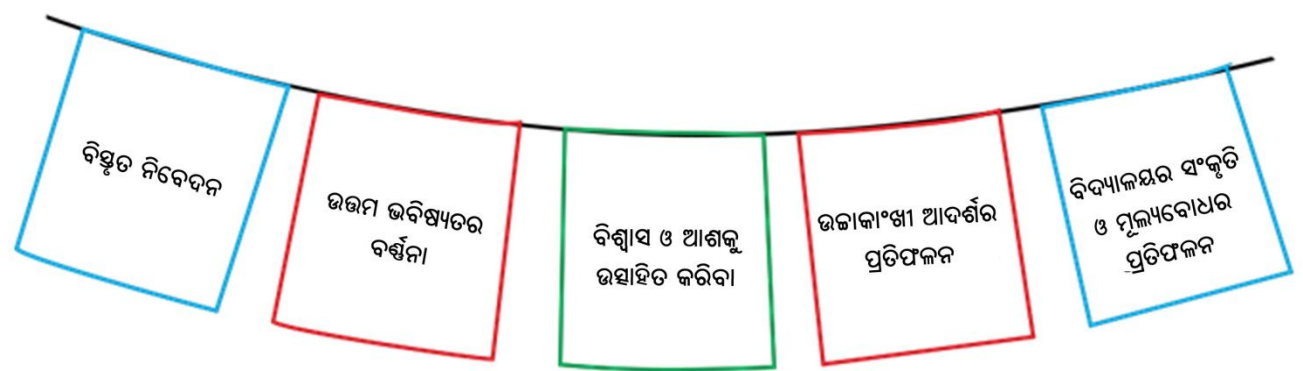
(ଚିତ୍ର-୨ : ଏକ ସୁନ୍ଦର ଆଭିମୁଖ୍ୟ ଉକ୍ତିର ବୈଶିଷ୍ଟ୍ୟ)

ଶିକ୍ଷାର୍ଥୀଙ୍କ ସହ ଏବଂ ଶିକ୍ଷାର୍ଥୀଙ୍କ ବିଷୟରେ ଆଲୋଚନା କରି ଆପଣ ଅନ୍ତର୍ନିବେଶୀ ମୂଲ୍ୟବୋଧଗୁଡ଼ିକୁ ପ୍ରସ୍ତୁତ କରିପାରିବେ । ସମସ୍ତଙ୍କୁ ଆପଣାଇବାର ମୂଳ ସମ୍ବଳଟିକୁ ଆପଣ ନିଜର ଶିକ୍ଷକମାନଙ୍କୁ ସହାୟତା ପ୍ରଦାନ କରିବାରେ ବ୍ୟବହାର କରିପାରିବେ, ଯାହା ଫଳରେ ସେମାନେ ଅନ୍ତର୍ନିବେଶୀ ପରିସ୍ଥିତିର ବ୍ୟବହାରଗୁଡ଼ିକ ପ୍ରସ୍ତୁତ କରିପାରିବେ ।