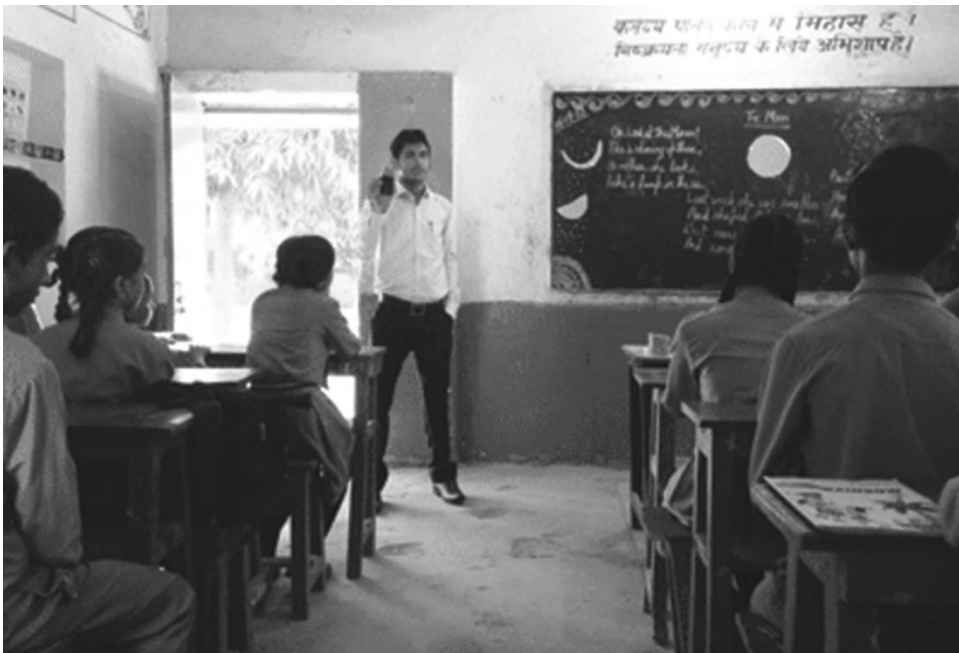
चित्र 2: कक्षा में ऑडियो रिकॉर्डिंग्स का उपयोग करना।