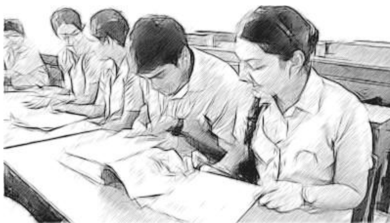
चित्र 1: चित्र बनाते हुए छात्र-छात्रा।

निर्देश देने के बाद, मैंने अपने छात्र-छात्राओं से एक दूसरे के साथ अपने चित्रों की तुलना करने को कहा [चित्र 1]। जब उन्होंने एक दूसरे के चित्रों को देखा तो वे हँसने लगे क्योंकि वे सभी बहुत अलग अलग थे। एक छात्रा ने देखा कि उसने पृष्ठ की बायीं ओर की बजाय दायीं ओर अपना भालू बना दिया था। तब मैंने उनसे Beehive पाठ्यपुस्तक के पृष्ठ 117 का चित्र देखने को कहा।