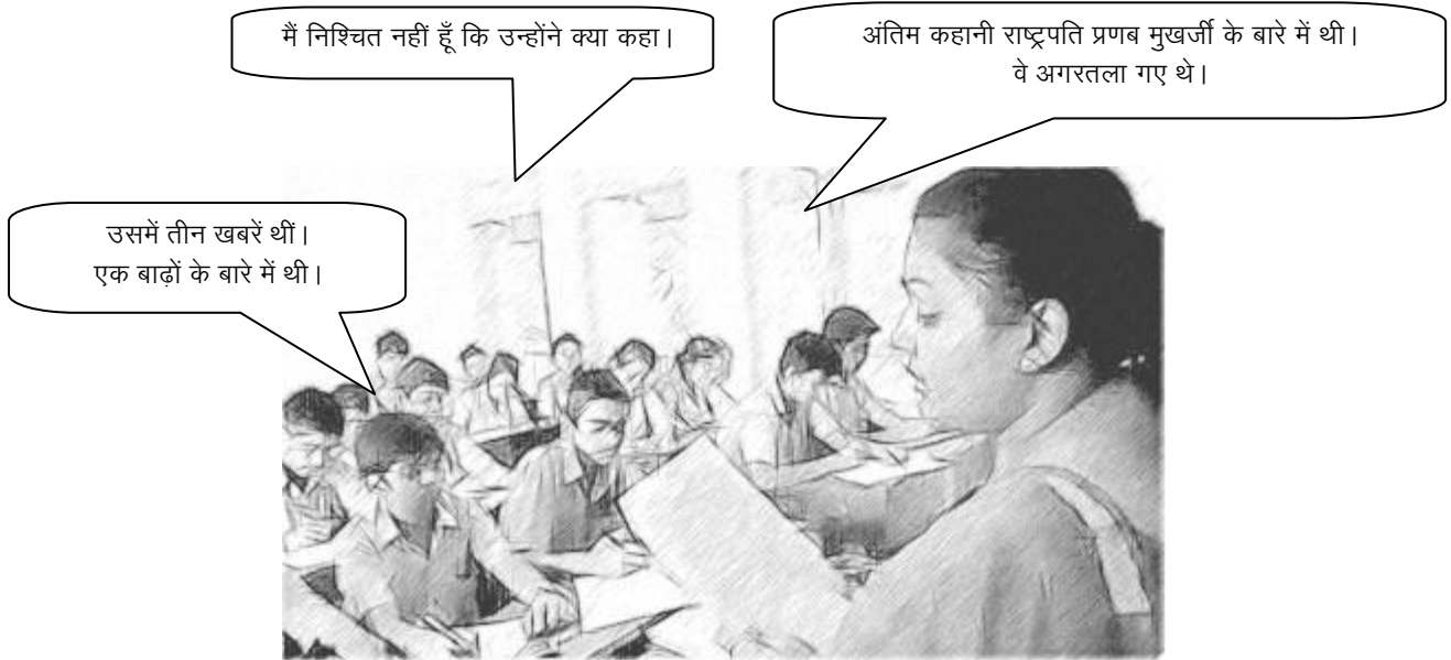
चित्र 3: यह स्पष्ट करते हुए छात्र-छात्रा कि उन्होंने क्या समझा है।

चाहती हूँ कि उन्होंने रिकॉर्डिंग के सामान्य मतलब को समझ लिया है या नहीं। इसलिए यदि वे अंग्रेजी में जवाब नहीं देते हैं, तो मैं उनसे उनके घर की भाषा में पूछती हूँ कि उन्होंने क्या समझा है [चित्र 3]।