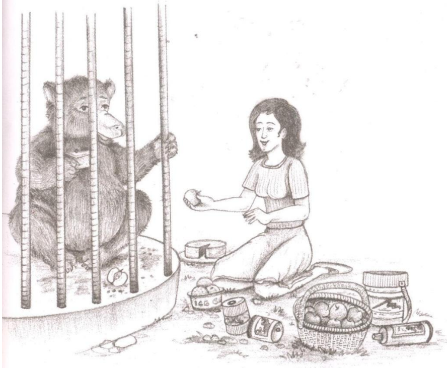
चित्र R1.1 एक पिंजरे में एक स्लॉथ बियर का चित्र (NCERT, 2006 ए, पृ. 117)।