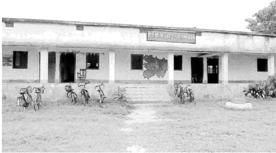
चित्र 2 किसी गतिविधि के लिए स्कूल के मैदान का उपयोग करना।