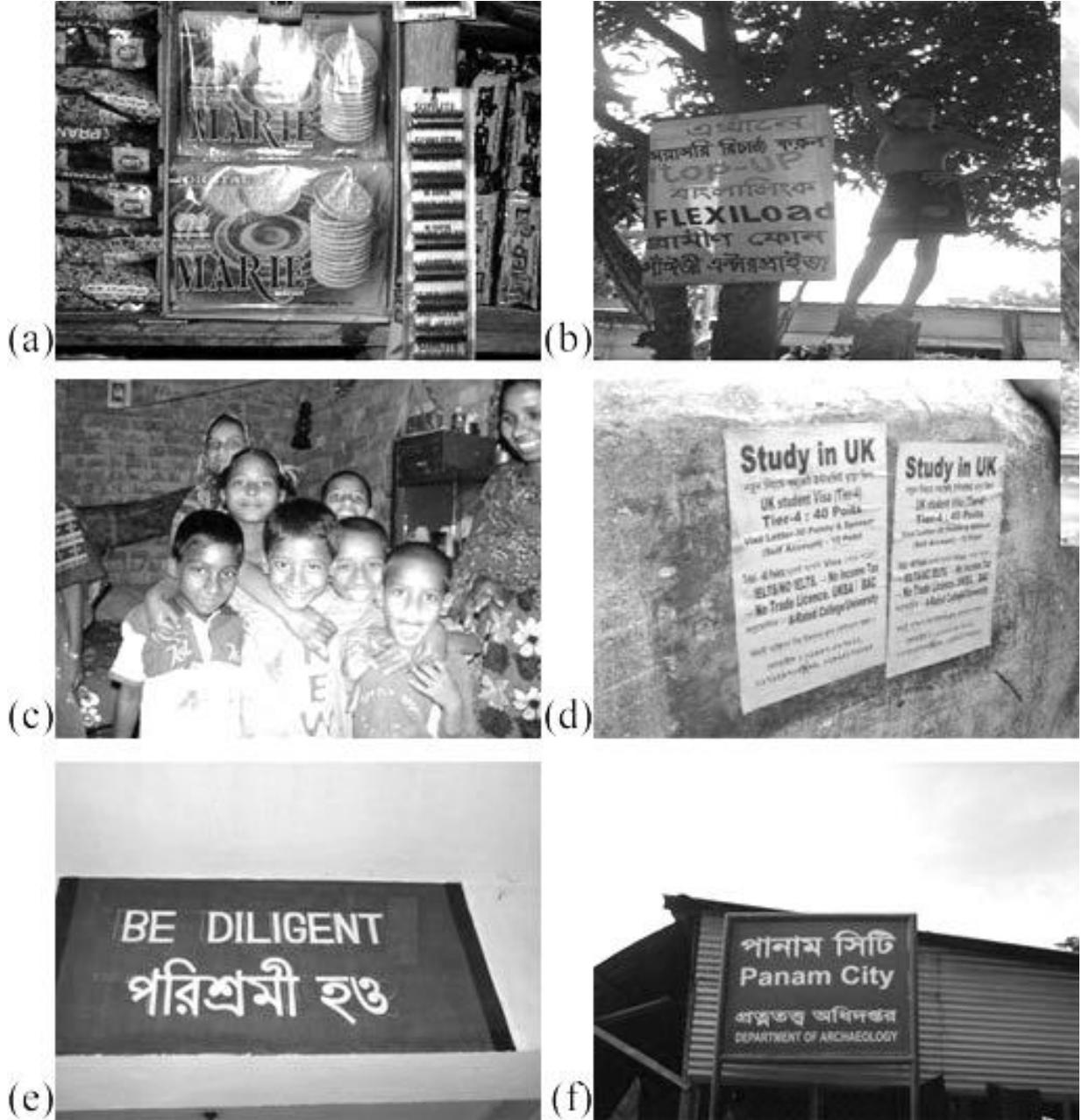
चित्र 1 समुदाय में अंग्रेजी के उदाहरण: (a) पैकेजिंग पर; (b) मोबाइल फोन सेवाओं के एक विज्ञापन में; (c) बच्चों की टी-शर्टों पर; (d) गाँव की दीवार पर लगे एक विज्ञापन में (e) स्कूल में द्विभाषी साइनबोर्ड पर; (f) सड़क किनारे लगे साइनबोर्ड पर।

अपनी सूची बना लेने के बाद, इसकी समीक्षा करें और इस बारे में सोचें कि क्या आपके विद्यार्थियों की भी इन स्थानों पर अंग्रेजी से संपर्क होने की संभावना है। क्या वे इस भाषा से परिचित होंगे? आप अपने भाषा पाठों में जो शब्द और वाक्यांश सिखाते हैं, क्या उनमें से कुछ स्थानीय पर्यावरण में भी मौजूद हैं? आपने जो उदाहरण इकट्ठे किए हैं, क्या आप उनमें से कुछ का उपयोग कक्षा में कर सकते हैं?