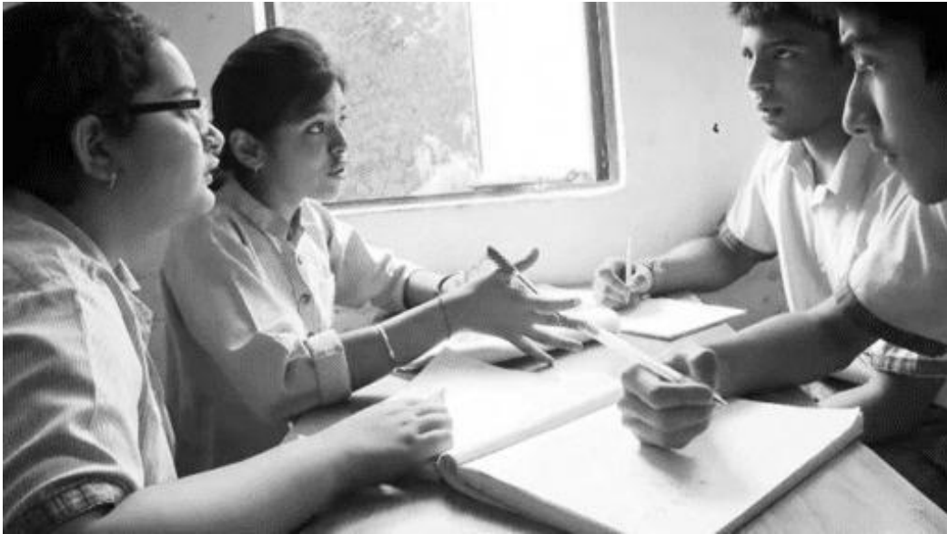
चित्र 1 साझा प्रोजेक्ट पर काम करते हुए छात्र-छात्रा

छात्र-छात्राओं के सहयोग संबंधी और सामाजिक कौशलों को विकसित करने के लिये, प्रोजेक्ट को छात्र-छात्राओं के छोटे समूहों से कराना सही होता है (चित्र 1), हालांकि इन्हें जोड़ियों में या अकेले भी किया जा सकता है। किसी प्रोजेक्ट टीम के लिये चार छात्र-छात्रा सामान्यतः सर्वोत्तम होते हैं। इससे बड़े समूहों में प्रत्येक छात्र/छात्रा का योगदान बहुत कम होता है और उनके लिये यह अर्थपूर्ण नहीं होता है; इससे छोटे समूहों में प्रत्येक छात्र/छात्रा को करने के लिये बहुत अधिक काम होता है। लेकिन अंततः, अपनी कक्षा के आकार के आधार पर, उपलब्ध संसाधनों के आधार पर और प्रोजेक्ट की प्रकृति के आधार पर आपको निर्णय लेना होता है।