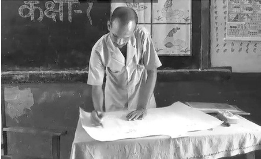
चित्र 3 जोड़ी में काम करने वाले पाठ की योजना बनाना।

संसाधन 1 के विचारों व मार्गदर्शन का उपयोग करके और केस स्टडी 1 व 2 से सीख लेकर, एक ऐसे विषय का चयन करें, जिसके बारे में बात करने या घटना लिखने में आपके विद्यार्थियों की रुचि जागृत हो। आप उसे कक्षा की भाषा व साक्षरता पुस्तक के किसी अध्याय पर समुदाय के किसी हाल के आयोजन, किसी स्थानीय या राष्ट्रीय समाचार पर आधारित रख सकते हैं। यह सोचें कि जोड़ियों में काम करने से पहले आपके विद्यार्थी प्रोत्साहन के लिए क्या पढ़ेंगे, या उसके बाद पढ़ने के क्या अवसर होंगे।