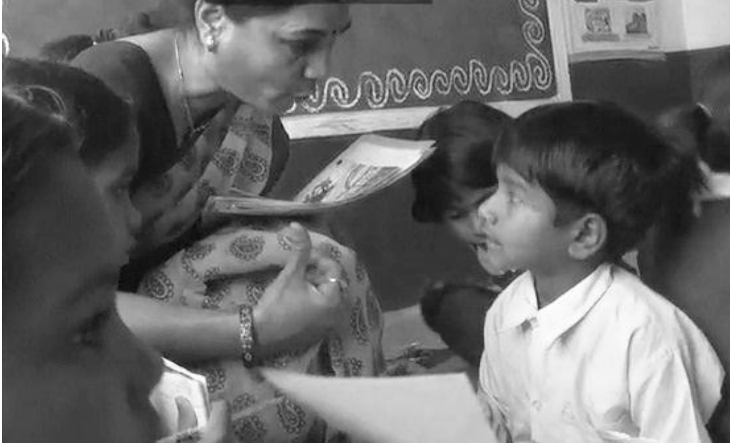
चित्र 2 जोड़ियों में काम का पर्यवेक्षण।

मूल्यांकन विद्यार्थियों की भाषा के विकास से संबद्ध हो सकता है, जैसे उनके द्वारा: