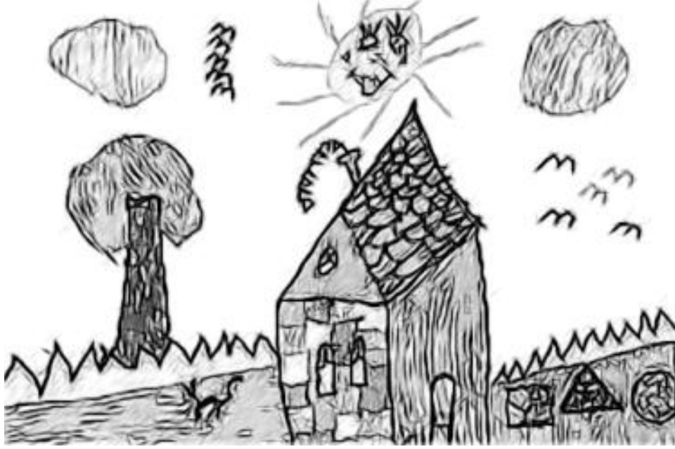
चित्र 2 कक्षा छ: के विद्यार्थी द्वारा बनाई गई एक अन्य पेंटिंग।

चित्र के बारे में अंग्रेजी में एक छोटा-सा परिच्छेद लिखें और उसे ऊंची आवाज़ में पढ़कर सुनाएँ।