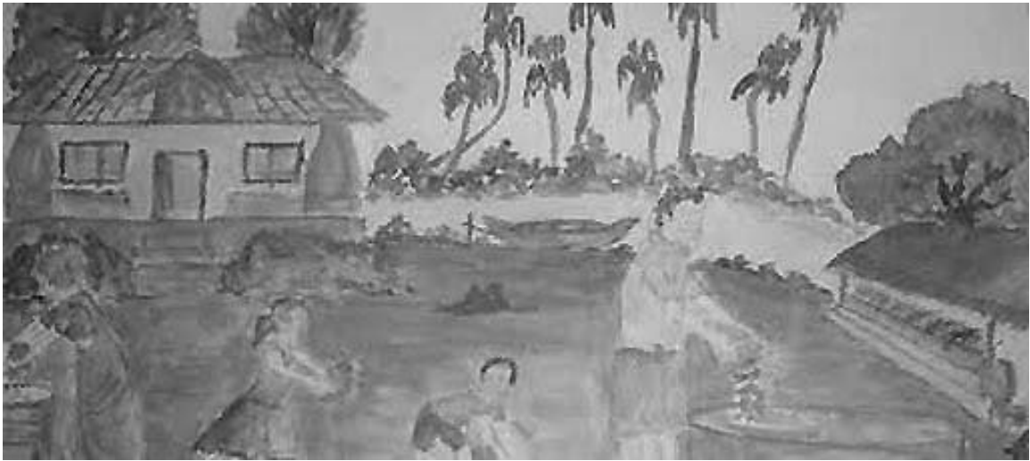
चित्र 1 कक्षा छ: के विद्यार्थी द्वारा बनाई गई पेंटिंग।

बॉक्स में दिए गए शब्दों के द्वारा परिच्छेद के खाली स्थान भरें।