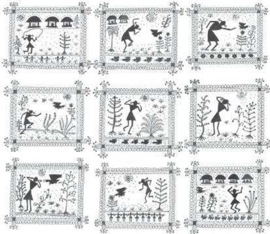
चित्र 3 सामुदायिक कथाएँ आपके अध्यापन के लिए एक उपयोगी संसाधन हैं।

कहानी सुनाना एक ऐसी साझा गतिविधि है, जो परिवार या समुदाय को साथ जोड़कर रख सकती है, इतिहास की याद दिला सकती है और भाषाओं और संस्कृतियों को संरक्षित रख सकती है। ऐसी कई कहानियाँ होती हैं, जो समुदाय के बुजुर्गों को याद होंगी। इन कहानियों को इकट्ठा करना आपके छात्रों, उनके परिवारों और समुदाय को स्कूल के जीवन में शामिल करने का एक रोमांचक तरीका है। आप केस स्टडी 2 में एक उदाहरण के बारे में पढ़ सकते हैं कि किस तरह एक कक्षा में ऐसा किया जाता है।