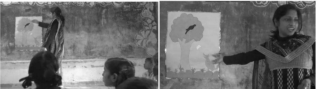
चित्र 1 कक्षा में कहानियों का उपयोग करना।

कहानियाँ सुनने से छात्रों को नई शब्दावली, वाक्यांशों और भाषा संरचनाओं को जानने का मौका मिलता है, जिससे बोलने और लिखने की उनकी संवाद क्षमताएँ बढ़ती हैं। जब आपके छात्र कहानियाँ सुनते हैं और उन्हें खुद कहानियाँ सुनाने का मौका दिया जाता है, तो उनके भाषा कौशल में वृद्धि होती है।