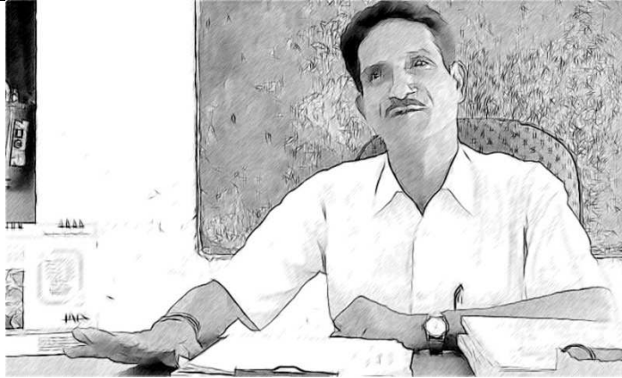
ಚಿತ್ರ-1 ಒಬ್ಬ ಆಲೋಚನಾಶೀಲ ನಾಯಕನ ಚಿತ್ರ