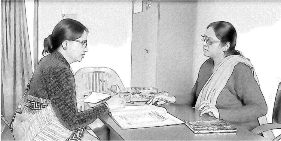
ಚಿತ್ರ ಎರಡು - ನಿಮ್ಮ ಶಿಕ್ಷಕರು ವೃತ್ತಿಪರತೆಯನ್ನು ನಿಮ್ಮನ್ನು ಅನುಸರಿಸುವರು.

ನಿಮ್ಮ ಕಲಿಕೆಯ ಬಗೆಗಿನ ನಿಮ್ಮ ಧೋರಣೆಯು, ನಿಮ್ಮ ಶಿಕ್ಷಕರು ಅವರ ವೃತ್ತಿಪರ ಬೆಳವಣಿಗೆ ಬಗ್ಗೆ ಹೊಂದಿರುವ ಧೋರಣೆಯ ಮೇಲೆ ನೇರವಾಗಿ ಪರಿಣಾಮ ಬೀರುತ್ತದೆ. ನಿಮ್ಮಲ್ಲಿನ ಬದಲಾವಣೆಗೆ ಇರುವ ತಯಾರಿ, ಹಾಗೂ ಕೌಶಲಗಳಲ್ಲಿ ಆಗಿರುವ ಬೆಳವಣಿಗೆ, ಅವರನ್ನು ಸಹ ಬದಲಾಗಲು, ಬೆಳೆಯಲು ಪ್ರೋತ್ಸಾಹಿಸುತ್ತದೆ. ನಿಮ್ಮ ಅತಿದೊಡ್ಡ ಸಂಪನ್ಮೂಲವೆಂದರೆ ನಿಮ್ಮ ಶಿಕ್ಷಕರು. ಆದ್ದರಿಂದ ಅವರಿಗೆ ಸಾಧ್ಯವಿರುವಷ್ಟು ಉತ್ತಮ ಶಿಕ್ಷಕರಾಗಿ ಹೊರ ಹೊಮ್ಮಲು, ನೀವು ಅವಶ್ಯಕ ಅವಕಾಶಗಳನ್ನು ಪೂರೈಸ ಬೇಕಾಗುತ್ತದೆ.