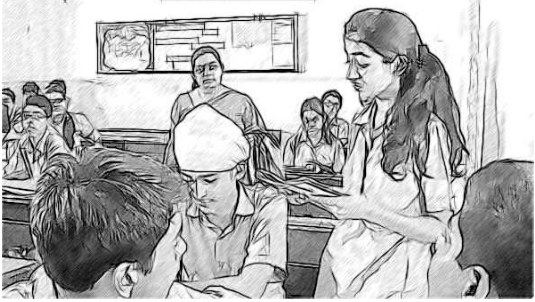
ಚಿತ್ರ 3 ಕ್ಷೇತ್ರ ಭೇಟಿಯ ಕುರಿತು ಒಂದು ವಿವರಣೆ.

ನಾವು ಬಂಗಾರಪೇಟೆಯನ್ನು ತಲುಪ ಬೇಕಾಗಿತ್ತು. ಇದು ಕುಪ್ಪಂಗೆ ನಮ್ಮ ಎರಡನೆಯ ಮತ್ತು ಕೊನೆಯ ಭೇಟಿಯಾಗಿತ್ತು. ನಾವು ಎಂಟನೇ ತರಗತಿಯಲ್ಲಿರುವಾಗ ಪ್ರಥಮ ಭೇಟಿ ನೀಡಿದ್ದೆವು. ಆಶ್ಚರ್ಯವೆಂದರೆ, ಈ ಬಾರಿ ಕುಪ್ಪಂನಲ್ಲಿ ನಮ್ಮ ಎಲ್ಲಾ ಅನುಭವಗಳೂ ವಿಭಿನ್ನವಾಗಿದ್ದವು. ಎಲ್ಲಾ ಸಿದ್ಧತೆಗಳು ಬಹಳ ಚೆನ್ನಾಗಿ ಸಂಯೋಜಿಸಿದ್ದರು ಮತ್ತು ನಾವು ತುಂಬಾ ಆರಾಮವಾಗಿ ಇದ್ದೆವು.