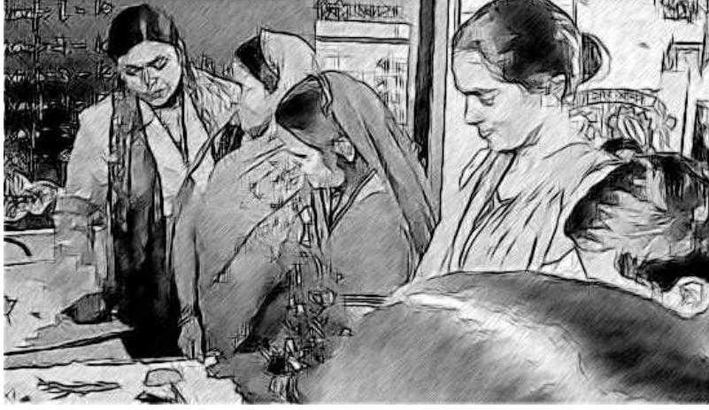
ಚಿತ್ರ 5 ನಿಮ್ಮ ವಿದ್ಯಾರ್ಥಿಯ ಪೋಷಕರೊಡನೆ ತೊಡಗಿಕೊಳ್ಳುವುದು ತೀರಾ ಅಗತ್ಯ.

ಕೇವಲ ಈ ವಿಧಾನಗಳಿಂದ ಮಾತ್ರವೇ ತಂದೆ ತಾಯಿಯರನ್ನು ಅವರ ಮಕ್ಕಳ ಶಾಲೆಯ ಚಟುವಟಿಕೆಗಳಲ್ಲಿ ತೊಡಗಿಸಿಕೊಳ್ಳಲು ಆಗುವುದಿಲ್ಲ. ಲೆಕ್ಕಪರಿಶೋಧನೆಯು ಈ ಪ್ರಕ್ರಿಯೆಯನ್ನು ಉತ್ತಮ ಪಡಿಸಿಕೊಳ್ಳಲು ಹಲವು ಮಾರ್ಗೋಪಾಯಗಳನ್ನು ನೀಡಬಹುದು. ನಿಮ್ಮ ಸ್ಕೋರ್‌ಗಳನ್ನು ಕೂಡಿದಾಗ, ತಂದೆತಾಯಿಯರನ್ನು ಎಷ್ಟರ ಮಟ್ಟಿಗೆ ನಿಮ್ಮ ಶಾಲೆಯಲ್ಲಿ ತೊಡಗಿಸಿಕೊಂಡಿದ್ದೀರಿ ಎಂಬುದರ ಶೇಖಡಾವಾರು ಫಲಿತಾಂಶ ತಿಳಿಯುತ್ತದೆ.