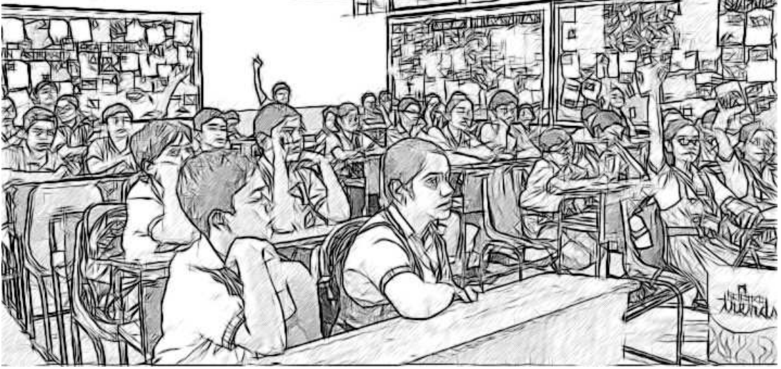
ಚಿತ್ರ 2 ಇತರ ಶಾಲೆಗಳು ಮತ್ತು ಎನ್.ಜಿ.ಒ.ಗಳೊಂದಿಗಿನ ಸಹಭಾಗಿತ್ವದಿಂದ ನಿಮ್ಮ ಶಾಲೆಯ ವಿದ್ಯಾರ್ಥಿಗಳಿಗೆ ಪ್ರಯೋಜನವಾಗುತ್ತದೆ.