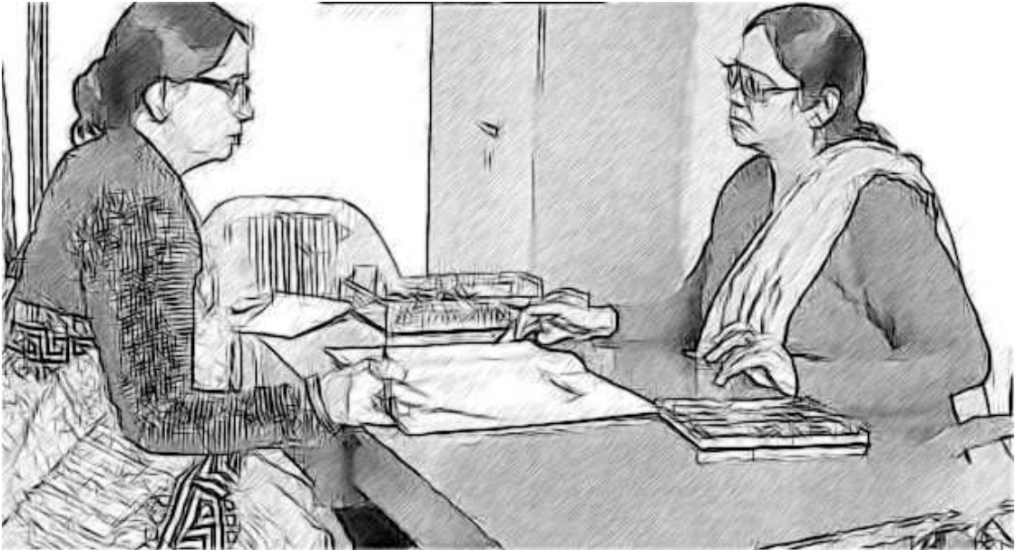
ಚಿತ್ರ 1: ಶಾಲಾ ನಾಯಕರಾಗಿ ನೀವು ರಾಜ್ಯದ ಯೋಜನೆ ಮತ್ತು ಕಾರ್ಯಕ್ರಮಗಳನ್ನು ಅರಿತಿದ್ದರೆ ನಿಮ್ಮ ಶಾಲೆಗೆ ಮತ್ತು ವಿದ್ಯಾರ್ಥಿಗಳಿಗೆ ಅವುಗಳ ಅನುಕೂಲತೆಯನ್ನು ಪಡೆಯುವಂತೆ ಯೋಜನೆ ಕೈಗೊಳ್ಳಬಹುದು.

ಈ ಜವಾಬ್ದಾರಿಗಳನ್ನು ಕಂಡುಕೊಳ್ಳಲು ರಾಜ್ಯದಲ್ಲಿ ವಿವಿಧ ಪ್ರಯತ್ನಗಳು ಹಾಗೂ ಯೋಜನೆಗಳ ಲಭ್ಯತೆ ಇದೆ. ಉದಾ: ಪೂರ್ವಪ್ರಾಥಮಿಕ ಶಾಲೆಯ ಸುತ್ತ ಆವರಣದ ಬೇಲಿ, 50 ಸಾವಿರ ಶಿಕ್ಷಕರ ಹುದ್ದೆಗಳನ್ನು ತುಂಬಲು ನೇಮಕಾತಿ ಪ್ರಕ್ರಿಯೆ, ಕಲಿಕಾ ನ್ಯೂನತೆಯುಳ್ಳ ಮಕ್ಕಳಿಗಾಗಿ ವಿಶೇಷ ಸೇವೆಗಳನ್ನೊಳಗೊಂಡ ಸಂಚಾರಿ ವಾಹನಗಳು ಅಥವಾ, ರಾಜ್ಯಾದ್ಯಂತ ತಾಂತ್ರಿಕ ಮೂಲಭೂತ ಸೌಕರ್ಯಗಳ ವ್ಯವಸ್ಥೆಯ ನಿರ್ಮಾಣ ಇತ್ಯಾದಿಗಳನ್ನು ಒಳಗೊಂಡಂಥಹ 3 ವರ್ಷಗಳ ಕಾರ್ಯಕ್ರಮ.