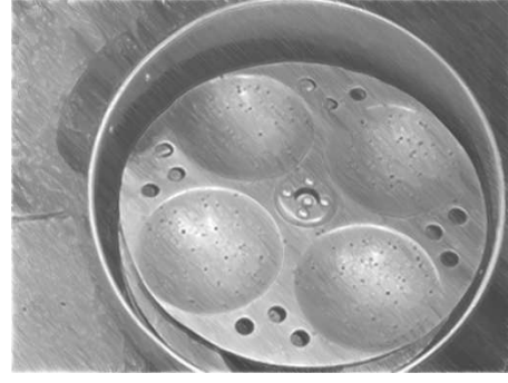
चित्र 5 इडली मेकर।