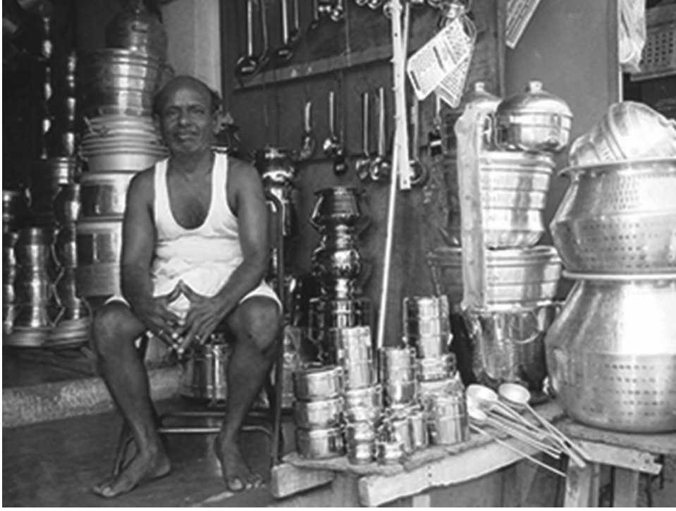
चित्र 2 अपनी दुकान में कुर्सी पर बैठा एक आदमी, जिसके चारों ओर मटके, कढ़ाई और रसोईघर के अन्य बर्तन हैं।

प्रत्येक विद्यार्थी से कक्षा में एक बर्तन लाने को कहें (उदाहरण के लिए, एक चम्मच, गिलास, बाउल (कटोरी), पात्र (किसी भी आकृति का), बोतल, परोसने का चम्मच (कढछी), कड़ाही, पैन आदि)। यह एक अच्छा विचार है कि आप स्वयं भी कुछ उदाहरण लाएँ, ताकि हर किसी के लिए पर्याप्त बर्तन हों।