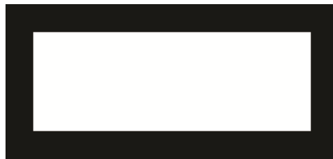
चित्र 3 एक खोखला आयत।