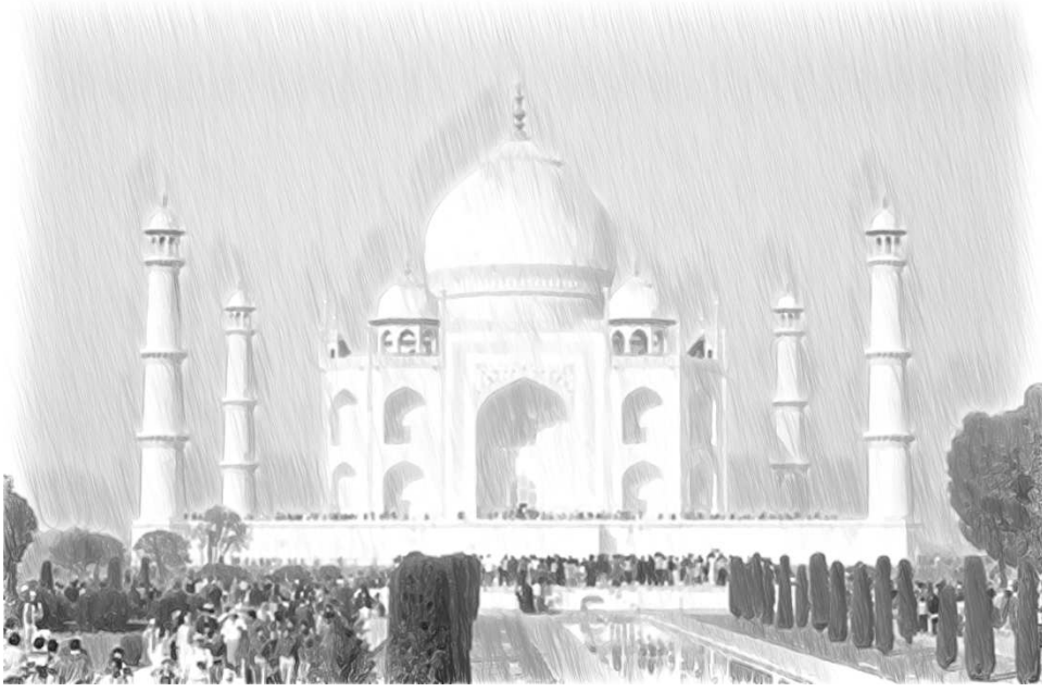
चित्र 1 ताज महल

विद्यालय के गणित में और वास्तविक जीवन में भी संयुक्त आकृतियों और ठोस पदार्थों पर काम करने में सहज महसूस करना महत्वपूर्ण होता है। इमारतों, कुर्सियों, रंगोली के पैटर्न, मस्जिदों और मंदिरों सभी में केवल एक आकृति या ठोस वस्तु नहीं, बल्कि इनमें से कई आकृतियाँ एक साथ जुड़ी होती हैं। लोग आकृतियों, ठोस पदार्थों और आयतन के संयोजनों से परिचित होते हैं, लेकिन विद्यार्थी अक्सर विद्यालय में गणित को एक कठिन विषय महसूस करते हैं।