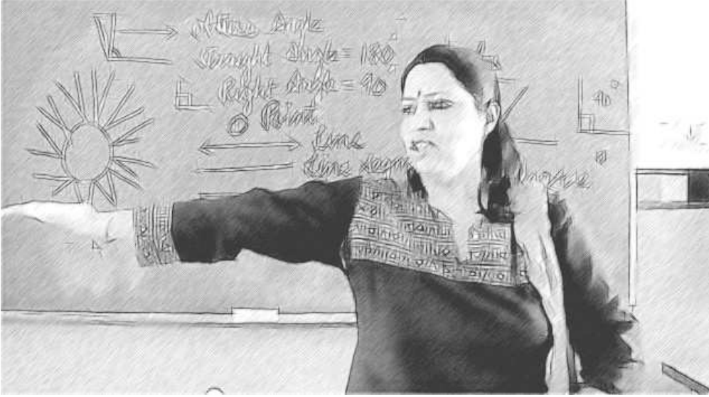
चित्र 2 इस गतिविधि के भाग 2 का प्रदर्शन करते हुए एक शिक्षिका।