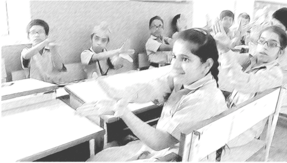
चित्र 1 इस गतिविधि के भाग 1 का प्रयास करते विद्यार्थी।

यह डिग्री संकेतों के आशुलिपि संकेतन से परिचित कराने (या सुदृढ़ बनाने) के लिए भी उपयुक्त अवसर है – उदाहरण के लिए, समकोण के लिए 90^\circ ।