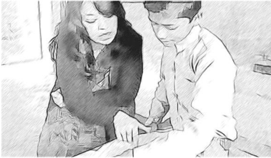
चित्र 1: जहाँ आवश्यक हो, अपने छात्र-छात्राओं की मदद करें।

ध्यान से पाठ पढ़ने के बाद, ऐसे खुले कथनों की शृंखला लिखें, जो आपके छात्र-छात्राओं को पढ़ाए जाने वाले मुद्दों के बारे में सोचने पर मजबूर करें। ऐसे कथनों के उपयोग से बचें, जो स्पष्ट रूप से 'सही' या 'ग़लत' हों, या जहाँ बस 'हाँ' या 'नहीं' में प्रतिक्रिया दी जानी हो।