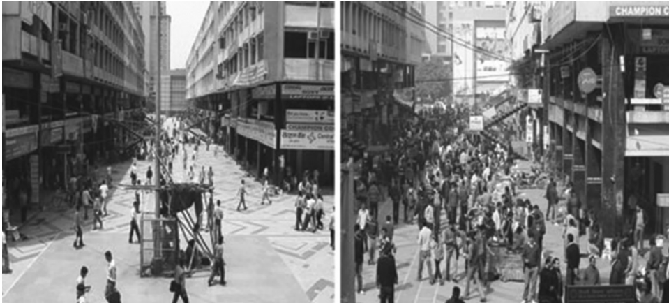
चित्र 1 वास्तविक जीवन में गतिकी: नेहरू प्लेस, दिल्ली, शांत (बाएँ) और व्यस्त (दाएँ)।

दिल्ली का नेहरू प्लेस, जो कंप्यूटर और पेरिफेरल का एशिया का सबसे बड़ा बाजार है, हमेशा भीड़ से भरा रहता है। कामकाज के समय यहाँ अत्यंत गतिशील वातावरण रहता है। सुबह से लेकर शाम तक जितनी तेजी से यहाँ वातावरण बदलता है, उससे एक हॉकर से लेकर कार पार्किंग या दुकान में कर्मचारियों की संख्या तक सभी कुछ प्रभावित होता है (चित्र 1)। वातावरण में इस बदलाव को गतिकी कहा जाता है।