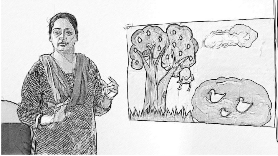
चित्र 1 अंग्रेजी शब्दों की पहचान करने में विद्यार्थियों की सहायता के लिए चित्रों का उपयोग।

यह तय करें कि आप इन अंग्रेजी शब्दों को कैसे प्रस्तुत करेंगे। क्या आप उनका अनुवाद करेंगे, या उन्हें किसी और तरीके से समझाएँगे? अंग्रेजी शब्दों को पहचानने और सीखने में विद्यार्थियों की सहायता करने के लिए आप चित्रों का भी उपयोग कर सकते हैं (चित्र 1)।