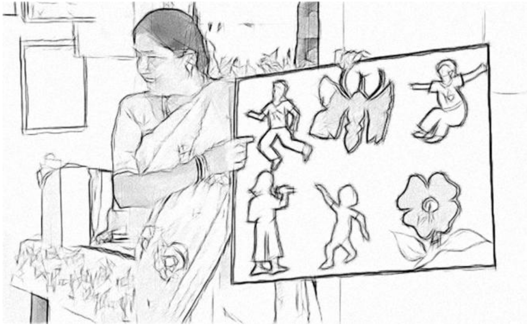
चित्र 2 एक कहानी सुनाने के लिए चित्रों का उपयोग करना।

अब मैं अंग्रेजी में कोई कहानी सुनाने से पहले, मुख्य शब्दों को बोलकर बोर्ड पर लिखती हूँ। कभी-कभी मैं कहानी के लिए चित्र भी तैयार करती हूँ (चित्र