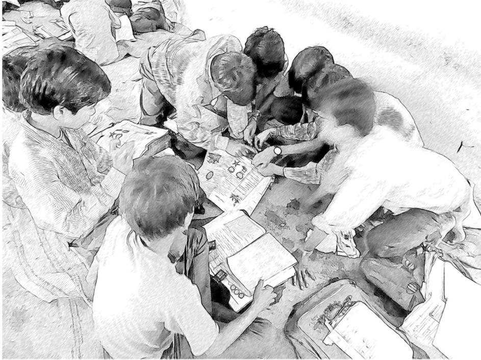
चित्र 1 समूहों में कार्य करने से आपके विद्यार्थियों की उपलब्धि बेहतर होगी।

बड़ी कक्षा में, विद्यार्थियों से जोड़ियों में काम करने के लिए कहना, आपके लिए कक्षा में घूमकर उनकी बातें सुनना कठिन बना देता है। परन्तु आप उन विद्यार्थियों पर ध्यान केंद्रित कर सकते हैं जिनके बारे में आपको ज्ञात है कि वे अपनी बात कहने में कम आत्मविश्वासी हैं। विज्ञान के अपने ज्ञान के बारे में अनिश्चित हैं। समूह चर्चा और पूरी-कक्षा चर्चा का उपयोग करना शुरू करने में, आपको और आपके विद्यार्थियों को समय लगेगा और इसके लिए तैयारी भी करनी होगी, परन्तु आत्मविश्वास, प्रेरणा और रुचि की दृष्टि से जो लाभ प्राप्त होंगे वे आसानी से दिखेंगे, उपलब्धि में वृद्धि (और गहरी जानकारी के लिए देखें संसाधन 2, 'समूहकार्य का उपयोग करना')। समूहों के साथ, आपके लिए निगरानी हेतु कम संख्या में पृथक इकाइयां होंगी और आप शीघ्र यह सुन व देख सकेंगे कि कैसे और विद्यार्थी कार्य व परिस्थिति पर प्रतिक्रिया दे रहे हैं।