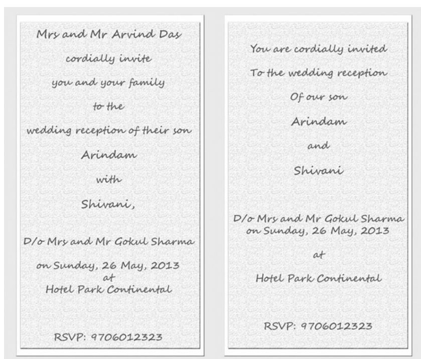
चित्र 3: दो वैवाहिक निमंत्रण।