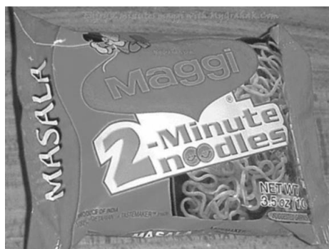
चित्र 2: एक मैगी फूड रैपर।