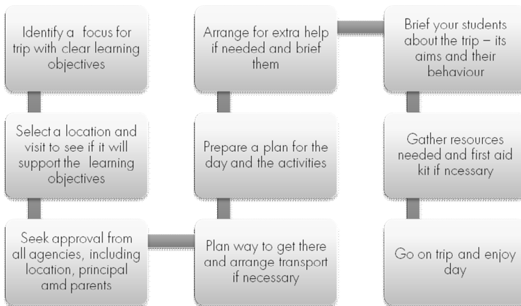
चित्र 1 विद्यालयी यात्रा के लिए योजना बनाना।