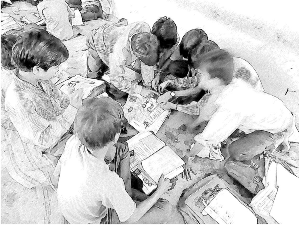
चित्र 1: समूहों में कार्य करने से आपके छात्र-छात्राओं की उपलब्धि बेहतर होगी।