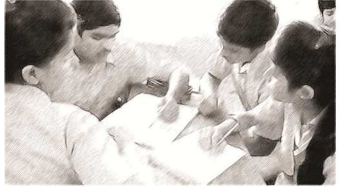
चित्र 1 विद्यार्थियों को समस्या हल करने के लिए जोड़ियों में काम करने के लिए कहा जाता है। फिर वे अपने समाधान की तुलना दूसरी जोड़ी से करते हैं।