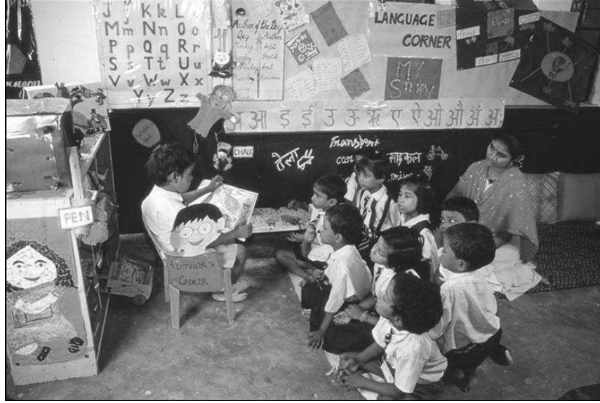
चित्र 3 एक छात्र अन्य छात्रों और शिक्षक को एक कहानी पढ़कर सुनाता है।

अब एक छात्र को बुलाएँ और वह कहानी शेष कक्षा को सुनाने को कहें (चित्र 3)। छात्र को पुस्तक पकड़ने दें और शिक्षक की तरह अभिनय करने दें। हो सकता है कि छात्र ने पाठ्य-सामग्री का कुछ भाग या पूरी सामग्री ही याद कर ली हो, इसमें कोई हर्ज नहीं है – छात्र को आपकी अभिव्यक्ति और उत्साह की नकल करने दें। अन्य छात्रों के साथ बैठें और उन्हें दिखाएँ कि एक अच्छा श्रोता कैसा होना चाहिए। यदि पठन में कोई सामूहिक भाग भी हैं, तो इसमें छात्रों के साथ शामिल हों।