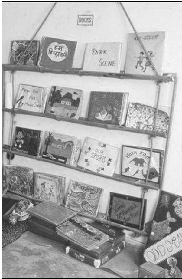
चित्र 2 कक्षा में पुस्तकों वाले हिस्से का एक उदाहरण।

अन्य शिक्षकों से इस बारे में बात करें कि किस तरह आप लोग साथ मिलकर पठन के लिए साझा संसाधन बना सकते हैं।