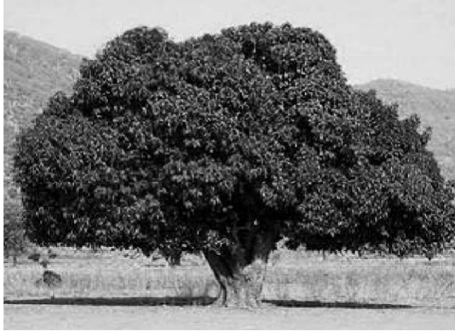
ଚିତ୍ର ସ 2.1: ଗୋଟିଏ ଆମ୍ବ ଗଛ