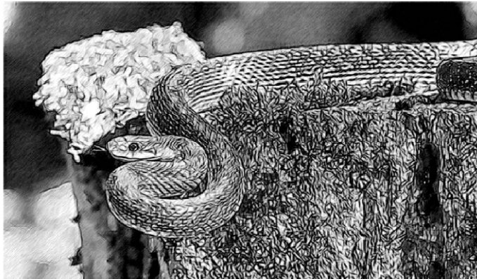
ଚିତ୍ର ସ 5.1 : ଢମାଣା ସାପ

ନିମ୍ନରେ ଦିଆଯାଇଥିବା ଗଛଟିକୁ ପଢ଼ନ୍ତୁ ଓ ଏହାକୁ ବିଜ୍ଞାନ ପାଠରେ କିପରି ବ୍ୟବହାର କରିବେ ଚିନ୍ତା କରନ୍ତୁ । ଗୋଟିଏ ଢମାଣା ସାପ ଏକ ବିଲରେ ଗାତରେ ରହୁଥିଲା । ସାପଟି ବିଲ ଓ ଗୋଦାମକୁ ଆସୁଥିବା ମୂଷାକୁ ଖାଇ ବଞ୍ଚୁଥିଲା । ଏକଦା ସାପଟି ଭୋକରେ ଥିବା ବେଳେ ଗୋଟିଏ ମୂଷାକୁ ଦେଖି ତାକୁ ଖାଇବାକୁ ଚେଷ୍ଟା କଲା । କିନ୍ତୁ ମୂଷାଟି ବହୁତ ଝଲାଇ ଥିଲା । ତେଣୁ ମୂଷାଟି ଖସିଯାଇ ଭିତରେ ଲୁଚିଗଲା ଏବଂ ଗୋଦାମ ଘରେ ଥିବା ଝଉଳ ଖାଇବାକୁ ଲାଗିଲା । ଅନ୍ୟ ମୂଷା ଭଳି ସେ ପ୍ରତିଦିନ 50 ଗ୍ରାମର ଝଉଳ ଖାଏ । ଦିନେ ତାର 8 ଟି ଛୁଆ ହେଲା । ଗୋଟିଏ ମା ମୂଷା 3 ସପ୍ତାହରେ ଛୁଆ ଜନ୍ମ କରେ । ମୂଷା ଏବଂ ତାର ଛୁଆମାନେ ଧୀରେ ଧୀରେ ବଢ଼ ହେଲେ । କାରଣ ସେଠାରେ ଥିବା ସାପଟିକୁ ଜମିର ମାଲିକ ମାରିଦେଇ ଥିଲା କାରଣ ସେ ଜାଣି ନଥିଲା ଯେ ଢମାଣା ସାପଟି ବିଷଧର ନୁହେଁ । (ଢମାଣା ସାପଟି ମଣିଷଙ୍କ ପାଇଁ କ୍ଷତିକାରକ ଏବଂ ବିଷ ଧର ନୁହେଁ) କମ୍ ଦିନ ମଧ୍ୟରେ ମୂଷାର ଛୁଆଗୁଡ଼ିକ ବଢ଼ ହୋଇଗଲେ ଏବଂ ଝଉଳ ଓ ଧାନ ଖାଇବା ଆରମ୍ଭ କଲେ । କାରଣ ମୂଷା ଛୁଆ ଗୁଡ଼ିକ 5 ସପ୍ତାହ ମଧ୍ୟରେ ବଢ଼ ହୋଇଯାନ୍ତି । ଏବଂ ମୂଷାଗୁଡ଼ିକ 5 ସପ୍ତାହ ପରେ ବଢ଼ ହୋଇ ସେମାନେ ଛୁଆ ଜନ୍ମ କରିବା ଆରମ୍ଭ କଲେ । ସମସ୍ତେ ମିଶି ଗୋଦାମ ଘରେ ଝଉଳ ଖାଆନ୍ତି । ଛଅ ସପ୍ତାହ ପରେ ସର୍ବ ପ୍ରଥମେ ମୂଷାଟି ଜେଜେମା ହୋଇଗଲା । ଏବଂ ତାର 8ଟି ଛୁଆ ବଢ଼ ହୋଇ ଆଠ, ଆଠଟି ଛୁଆ ଜନ୍ମ କରି ଦେଲେ ।