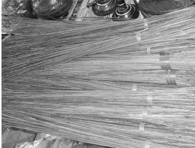
चित्र 1 नारियल की झाड़ू।

पाठ के आरंभ में, प्रत्येक विद्यार्थी से अपने हाथ में ली हुई छड़ी को पकड़े रहने और अपना हाथ उठाने के लिए कहें। यदि कुछ विद्यार्थी छड़ी लाना भूल गए हैं तो अन्य विद्यार्थियों से कहें कि वे उदारता दिखाते हुए अपनी छड़ी का कुछ हिस्सा उन विद्यार्थियों से बांटे।