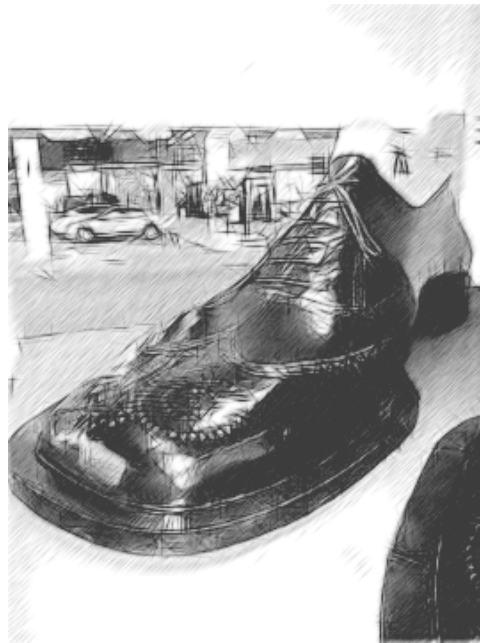
चित्र 2 दुनिया के सबसे बड़े जूतों की जोड़ी में से एक को मैरिक्ना में प्रदर्शित है, जिसे 'फिलीपींस की जूता राजधानी' भी कहा जाता है, जैसा कि 2002 के गिनीज़ बुक ऑफ़ वर्ल्ड रिकॉर्ड द्वारा प्रमाणित किया गया है।

यदि आपके विद्यार्थी इंटरनेट का उपयोग करते हैं, तो वे जूते की इस जोड़ी के बारे में और अधिक तस्वीरें और जानकारी खोजने के लिए किसी सर्च इंजन का उपयोग कर सकते हैं। यह आगे और भी उनकी उत्सुकता जगाने वाला सकता है! यदि आप प्रिंटर का उपयोग करते हैं, तो आप कक्षा के साथ बांटने के लिए कुछ बड़ी तस्वीरों का प्रिंट ले सकते हैं या गतिविधि के बाद विद्यार्थियों के कार्यों का एक रोमांचक दीवार प्रदर्शन बनाने में मदद कर सकते हैं।