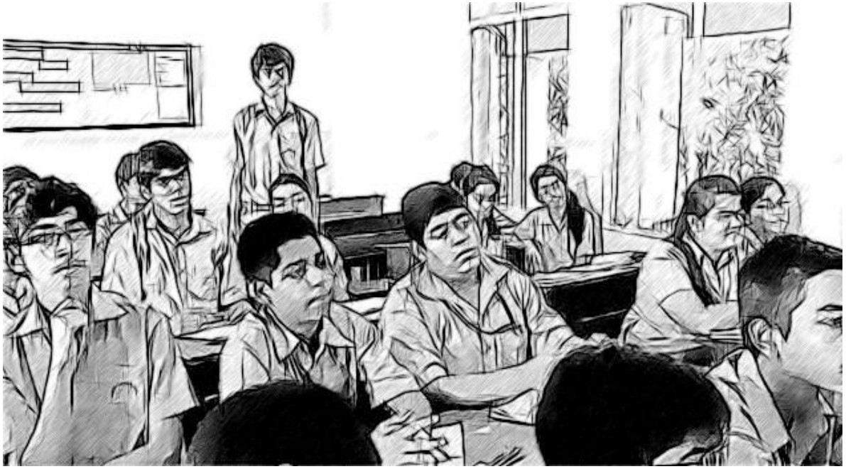
चित्र 1 विद्यार्थी पढ़ाई कर रहे हैं।

स्व-समीक्षा में, विद्यालय प्रमुख और शिक्षक अपने आपसे वही प्रश्न पूछते हैं जो कोई बाहरी समीक्षक उनसे पूछता है। जब उन्हें ऐसी किसी बात का पता चलता है जो वैसी नहीं होनी चाहिए (जैसे कि पिछले साल के मुकाबले इस साल की उपस्थिति खराब है), वे उस पर छानबीन करके कुछ कार्रवाई कर सकते हैं। विद्यालय ने क्या अच्छा किया और अधिकारिक तौर पर बाहरी समीक्षा होने से पहले क्या सुधारने की आवश्यकता है इसके बारे में पता लगाना 'स्व-समीक्षा' करना है।