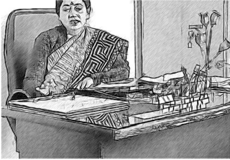
चित्र 4 एक रिपोर्ट की व्याख्या।

आपकी स्व-समीक्षा के लिए आँकड़े एकत्र करना, आरंभ बिंदु है। इसके बाद आपको प्रमाण का विश्लेषण करने (चित्र 2 में चरण 2) और ताकतों और सुधार के लिए क्षेत्रों का निर्णय लेने (चरण 3) की आवश्यकता होगी। विद्यालय स्व-समीक्षा की एक सामान्य निंदा यह होती है कि यह बहुत अधिक विवरणात्मक और अपर्याप्त तौर पर मूल्यांकनात्मक हो सकता है - विद्यालय नेतृत्व केवल यह विवरण देते हैं कि क्या हो रहा है और वे यह नहीं पूछते कि वे इससे क्या सीख सकते हैं।