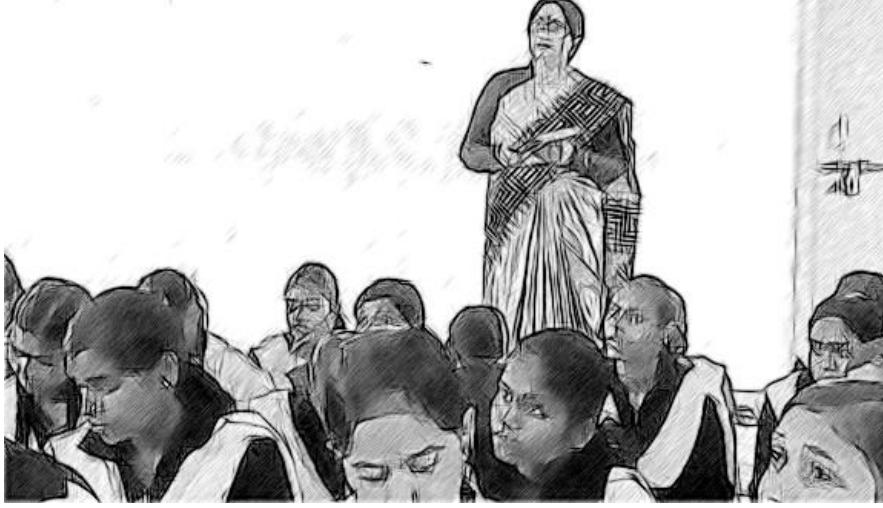
चित्र 5 एक विद्यालय प्रमुख अधिगम चहलकदमी करते हुए।

अधिगम चहलकदमी में विद्यालय प्रमुख या प्रधानाध्यापक क्या चल रहा है यह जानने के लिए विद्यालय दिवस के दौरान विद्यालय में टहलते हैं। अच्छे विद्यालय प्रमुख हमेशा से यह करते आए हैं। यह स्व-समीक्षा का एक आवश्यक घटक है क्योंकि इससे निम्नांकित को करने का मौका मिलता है: