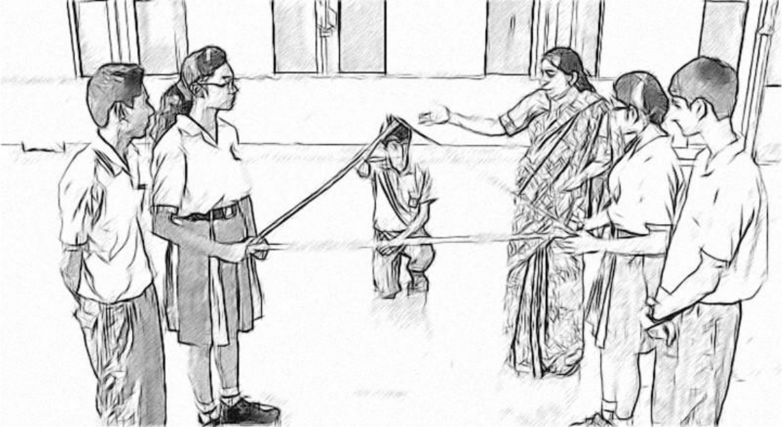
चित्र 1 त्रिभुज के साथ काम कर रहे छात्र-छात्राओं का एक समूह।

इस इकाई इस बात पर ध्यान केंद्रित करेगी कि आपके छात्र-छात्राओं को गणित सीखने के लिए बातचीत का उपयोग करने में कैसे मदद करें। इसमें यह भी चर्चा की जाएगी और विचारों की पेशकश होगी कि किस प्रकार छात्र-छात्रा अपने अधिगम में एक दूसरे की सहायता कर सकते हैं और एक दूसरे को प्रभावी प्रतिक्रिया दे सकते हैं। इस तरह के सहयोगी अधिगम से छात्र-छात्राओं को और अधिक प्रेरित महसूस करने में मदद मिलती है। यह बड़ी कक्षाओं में कार्य करते समय भी विशेष रूप से उपयोगी है।