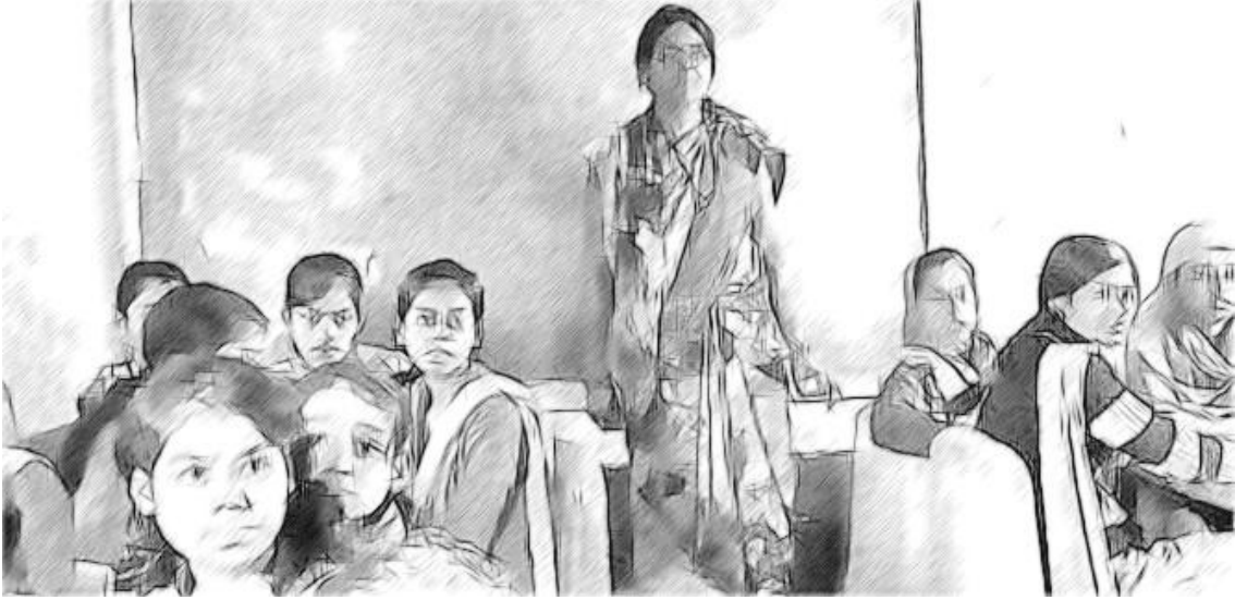
चित्र 1 प्रेक्षण के माध्यम से प्रमाण एकत्र करना।

यदि आप कक्षाओं में जाकर या शिक्षकों से बातचीत करके छात्रों की सीखने की प्रक्रिया पर नियमित रूप से डेटा एकत्र नहीं करते हैं, तो हो सकता है कि छात्रों की शिक्षा के बुरी तरह से हानिग्रस्त होने से पहले आपको कार्य-प्रदर्शन में इस कमी का पता न चले। इस वजह से, नियमित निगरानी करना आवश्यक होता है और उसे आपके रोजमर्रा के काम का हिस्सा होना चाहिए। निगरानी करके आप अच्छे कार्य-प्रदर्शन की पहचान और अच्छा काम कर रहे शिक्षकों को मान्यता भी प्रदान कर सकेंगे।