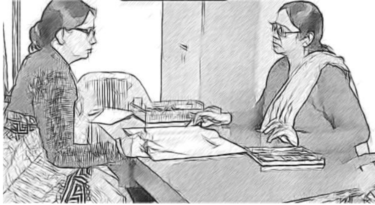
चित्र 3 आप किसी अपेक्षा से कम प्रदर्शन करने वाले शिक्षक को प्रतिक्रिया कैसे देंगे?

आपको संसाधन 1, 'निगरानी करना और प्रतिक्रिया देना' उपयोगी लग सकता है। इसमें आपके शिक्षकों के साथ इस दृष्टिकोण जैसी स्पष्ट समानताएं हैं।