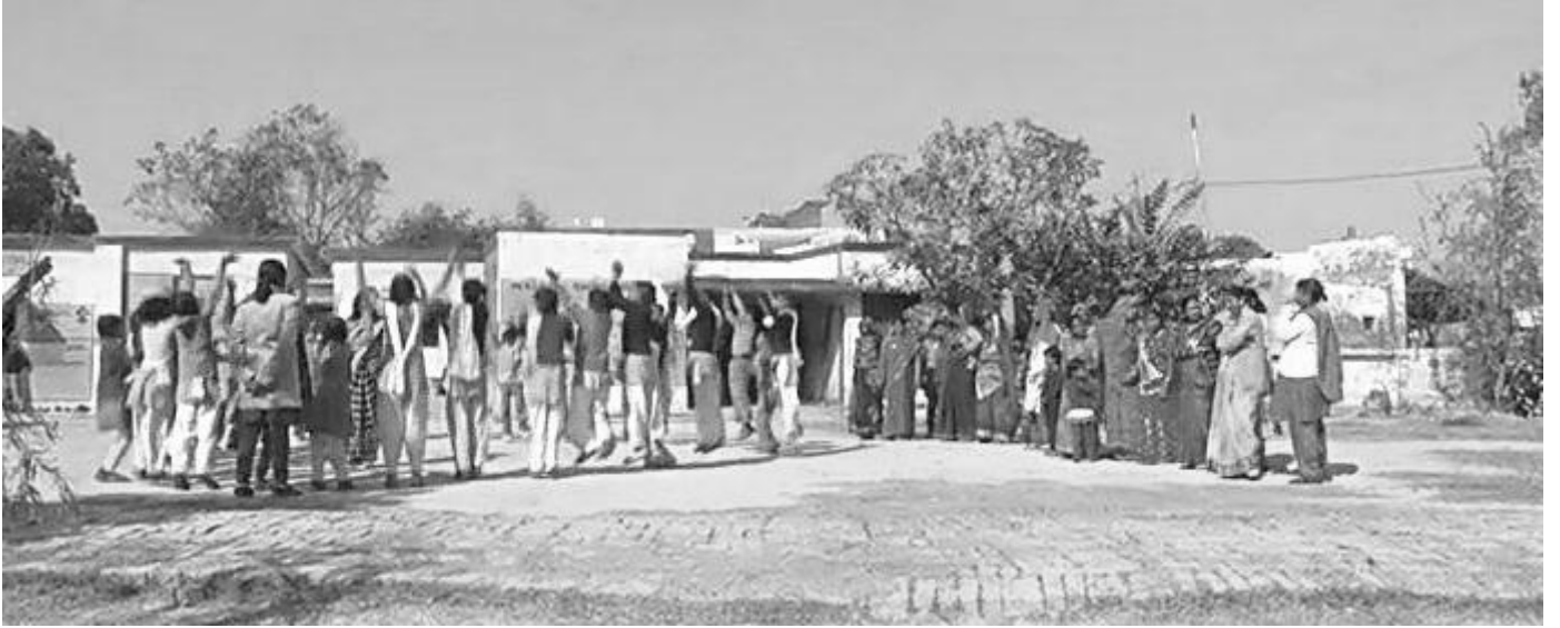
चित्र 1 अपने विद्यालय में समावेश को प्रोत्साहन देना ।