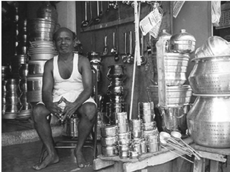
ଚିତ୍ର-2 ଜଣେ ଲୋକ ତା' ଦୋକାନରେ ଥିବା ଗୋଟିଏ ଚଉକି ଉପରେ ବସିଥିବାର ଚିତ୍ର । ସେ ବିଭିନ୍ନ ପାତ୍ର , ଥାଳିଆ ଓ ଅନ୍ୟାନ୍ୟ ରୋଷେଇ ସରଞ୍ଜାମ ଘେରରେ ବସିଛି ।

ପ୍ରତି ଶିକ୍ଷାର୍ଥୀଙ୍କୁ ଗୋଟିଏ ଲେଖାଏଁ ରୋଷେଇ ସରଞ୍ଜାମ ଆଣିବାକୁ କୁହନ୍ତୁ (ଉଦାହରଣ- ଗୋଟିଏ ଚାମଚ, ଗ୍ଲାସ, ଡକ୍