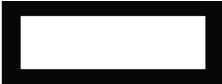
ଚିତ୍ର 3 – ଗୋଟିଏ ମଝି ଫାଙ୍କା ଥିବା ଆୟତଚିତ୍ର