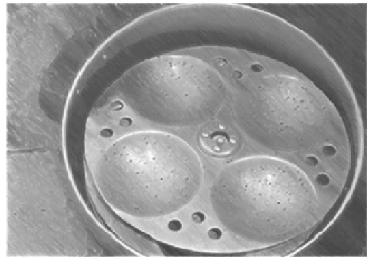
ଚିତ୍ର-5: ଗୋଟିଏ ଇଡଲି ଛାଞ୍ଚ