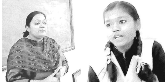
चित्र 1 छात्रों की भागीदारी से सीखने की क्रिया बेहतर बनेगी; शिक्षक भी शिक्षार्थी होते हैं।

शोध इस बात पर सहमत है। वास्तविकता यह है कि क्रियान्वयन कठिन है। कई शिक्षक यह मानते हैं कि कक्षा का आकार बड़ा होना या बहुश्रेणी या बहुभाषी कक्षाएं होना जैसे कारण उन्हें विद्यार्थी-केंद्रित पद्धतियां नहीं अपनाने देते हैं। टीईएसएस-इंडिया ओईआर केस स्टडी और गतिविधियों के रूप में क्रियात्मक उदाहरण प्रदान करते हैं जिन्हें शिक्षक अपनी कक्षाओं में लागू करके इन चिंताओं से मुक्ति पा सकते हैं।