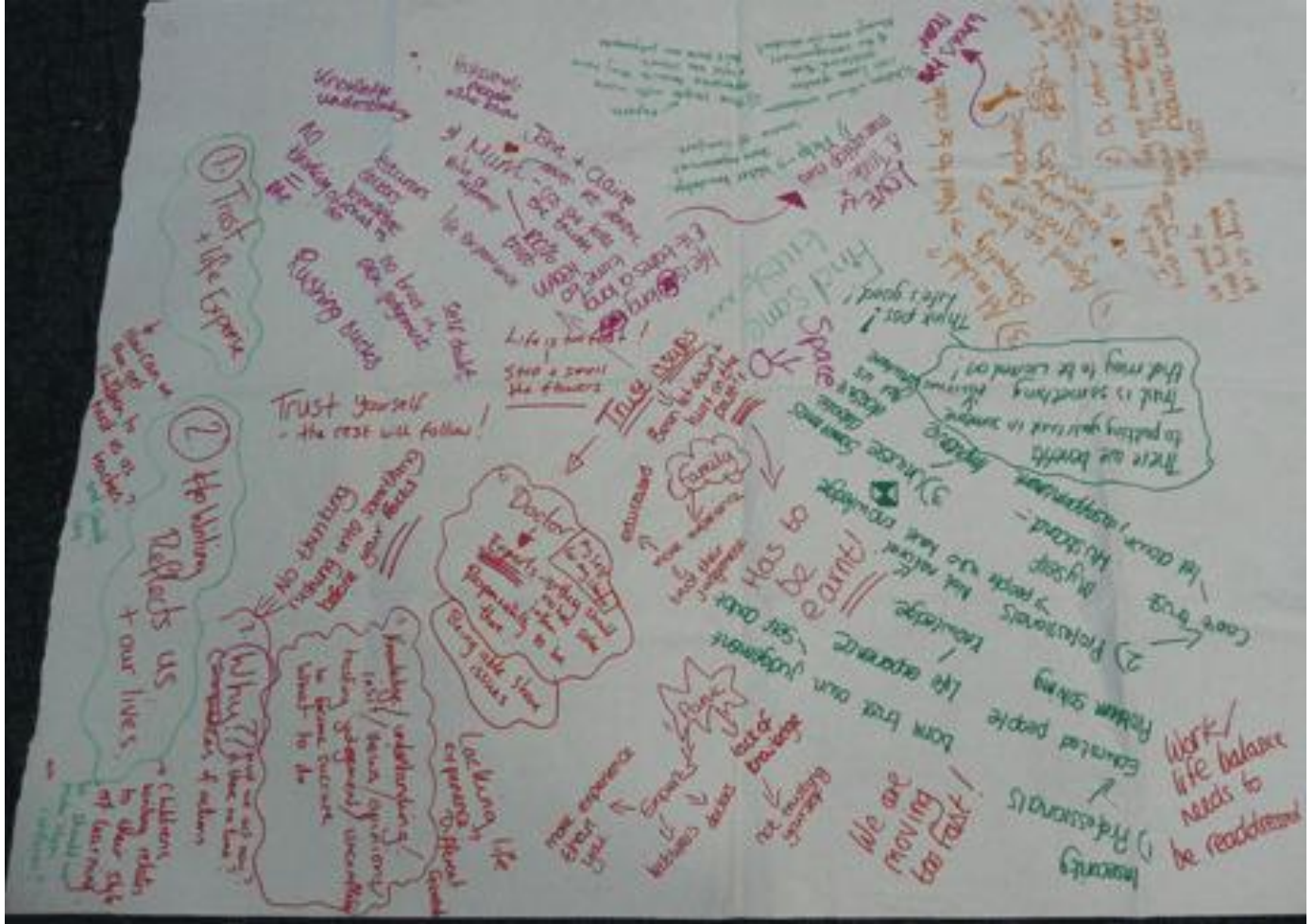
चित्र 7 अपने अध्यापकों के विचारों का संग्रह करना।

वाली नोट्स की पर्चियां हों तो आप अपने स्टाफ से उन पर लिख कर उन्हें कागज की उपयुक्त शीट पर चिपकाने को कह सकते हैं। एक अन्य विकल्प के तौर पर, आप कागजी मेजपोश का इस्तेमाल कर सकते हैं और स्टाफ से कह सकते हैं कि वे एक-एक करके मेजों पर जाते रहें और समूह के रूप में बैठ कर उस पर लिखते जाएं।