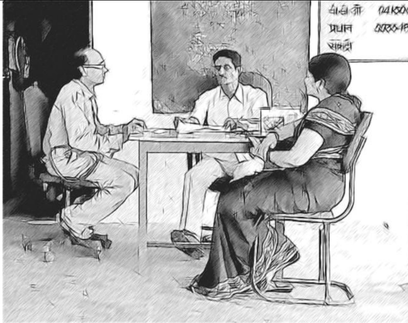
चित्र 4 विद्यालय नेता को अपने शिक्षकों को संलग्न करना चाहिए।