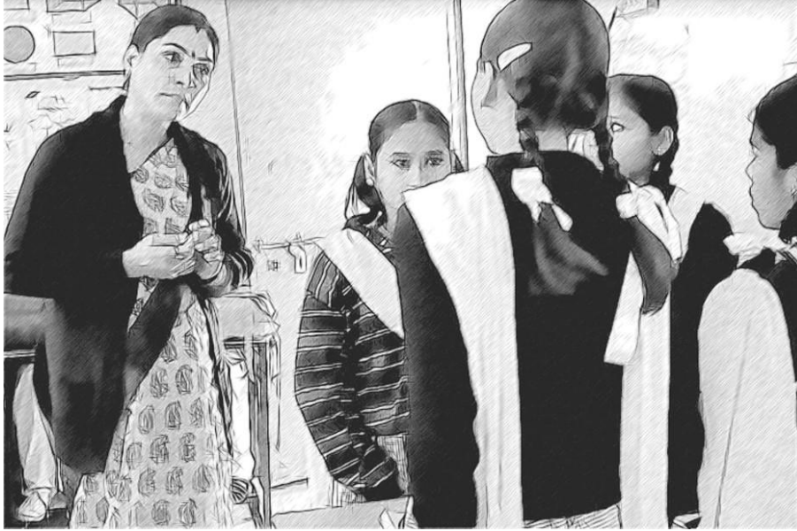
चित्र 5 कक्षाओं में बात कौन कर रहा है?

मैं यह जानने को बहुत उत्सुक थी कि शिक्षक अपनी कार्यप्रणाली किस प्रकार विकसित करेंगे और टीईएसएस-इंडिया ओईआर का इस्तेमाल कैसे करेंगे। मैंने शिक्षकों को प्रोत्साहित किया कि वे अपने अनुभवों के बारे में मुझसे और दूसरों से बात करें। इससे, मुझे चीजें कैसी चल रही हैं इस बारे में थोड़ी अंदरूनी जानकारी मिली। अब मैं जब भी कभी विद्यालय में टहलती हूँ, तो यह सुनने की कोशिश करती हूँ कि कक्षाओं में किस बारे में बात की जा रही है और बात कौन कर रहा है।