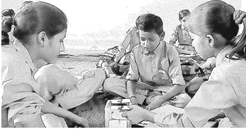
चित्र 3 आपको अपने विद्यालय में क्या सुधार करना है?

उदाहरण के लिए, हो सकता है कि आप जानते हों कि आपके शिक्षक कक्षाओं से पहले अपने पाठों के बारे में पर्याप्त रूप से नहीं सोचते हैं। तो इसके लिए आप पाठों की योजना बनाने पर ध्यान देने चुन सकते हैं। इससे न केवल पाठों के प्रस्तुतिकरण के तरीके में, बल्कि प्रयुक्त शिक्षण विधियों और संसाधनों की विविधता में भी सुधार संभव हो सकते हैं। वैकल्पिक तौर पर, हो सकता है कि आप चाहते हों कि विद्यार्थी थोड़ा अधिक बोलें ('सीखने के लिए बोलना' मुख्य संसाधन देखें), या हो सकता है कि आपके विद्यालय में बड़ी कक्षाएं हों और आप यह तय करें कि शिक्षकों के लिए बड़ी कक्षाओं को प्रभावी ढंग से पढ़ाना आसान बनाने के लिए विद्यार्थियों से जोड़ियों में कार्य करवाया जाए ('जोड़ी में कार्य का उपयोग करना')।