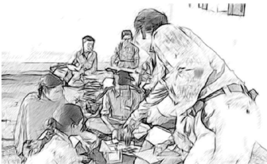
ଚିତ୍ର ୨ ଶ୍ରେଣୀରେ ଗଠନମୂଳକ ଓ ସମାପ୍ତିସୂଚକ ମୂଲ୍ୟାୟନର ବ୍ୟବହାର

ଗଠନମୂଳକ ମୂଲ୍ୟାୟନରେ ଶିକ୍ଷାର୍ଥୀମାନେ ଅଂଶଗ୍ରହଣକାରୀ ହେବାକୁ ହେଲେ ସେମାନେ ସକ୍ରିୟ ଓ ପ୍ରତିଫଳିତ ଶିକ୍ଷାର୍ଥୀ ହେବା ଆବଶ୍ୟକ । ସେମାନେ ପରବର୍ତ୍ତୀ ଶିକ୍ଷଣର ସୋପାନକୁ ମତାମତକୁ ବ୍ୟବହାର କରି ସ୍ଥିର କରନ୍ତି ।