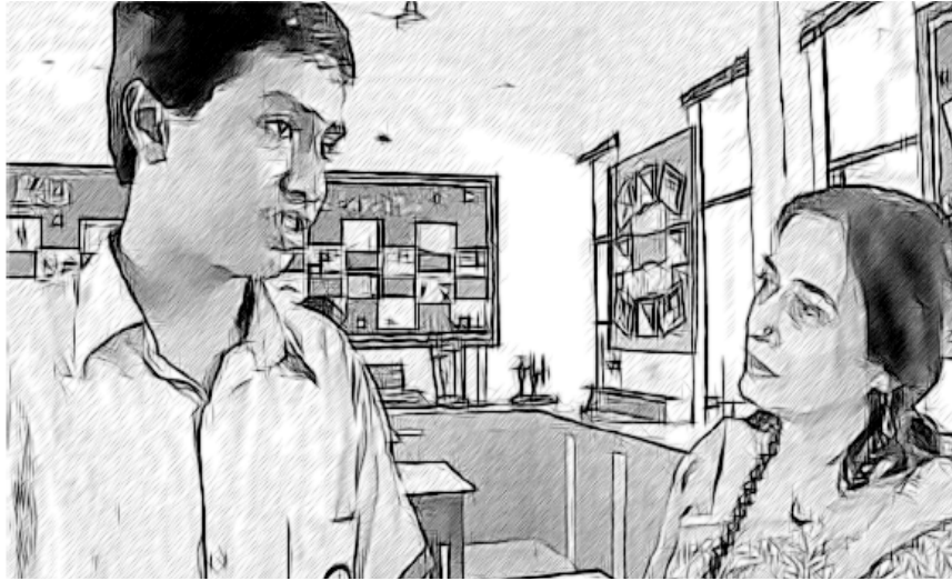
ଚିତ୍ର 1 ଶିକ୍ଷାର୍ଥୀ ଶିକ୍ଷଣରେ ଥିବା ପାଇଁ ବିଷୟରେ ଆଲୋଚନା

ସମାପ୍ତି ସୂଚକ ମୂଲ୍ୟାୟନରେ ସାଧାରଣତଃ ଗୋଟିଏ ଶିକ୍ଷାର୍ଥୀକୁ ଅନ୍ୟ ଶିକ୍ଷାର୍ଥୀ ସହ ତୁଳନା କରାଯିବା ପାଇଁ ବ୍ୟବହୃତ ହୋଇଥାଏ, କିନ୍ତୁ ଗଠନମୂଳକ ମୂଲ୍ୟାୟନ ଶିକ୍ଷଣର ଅଗ୍ରଗତି ପାଇଁ ବ୍ୟବହୃତ ହୋଇଥାଏ ।