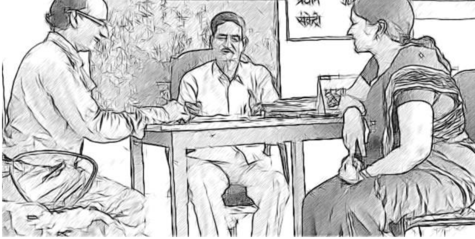
चित्र 1 विकास की जरूरतों पर चर्चा करते शिक्षक।