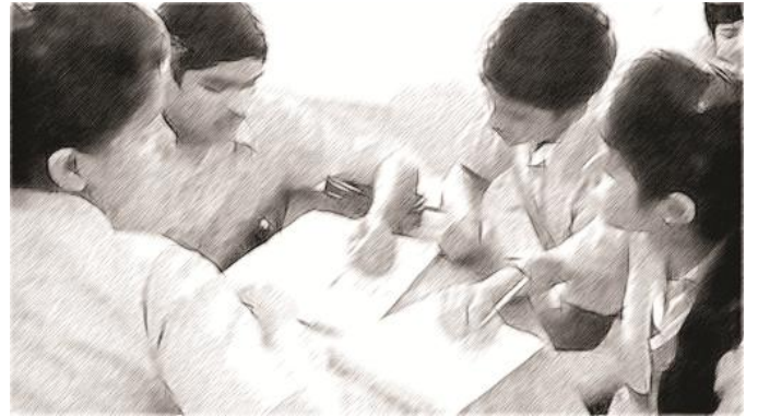
चित्र 1: छात्र-छात्राओं को समस्या हल करने के लिए जोड़ियों में काम करने के लिए कहा जाता है। फिर वे अपने समाधान की तुलना दूसरी जोड़ी से करते हैं।