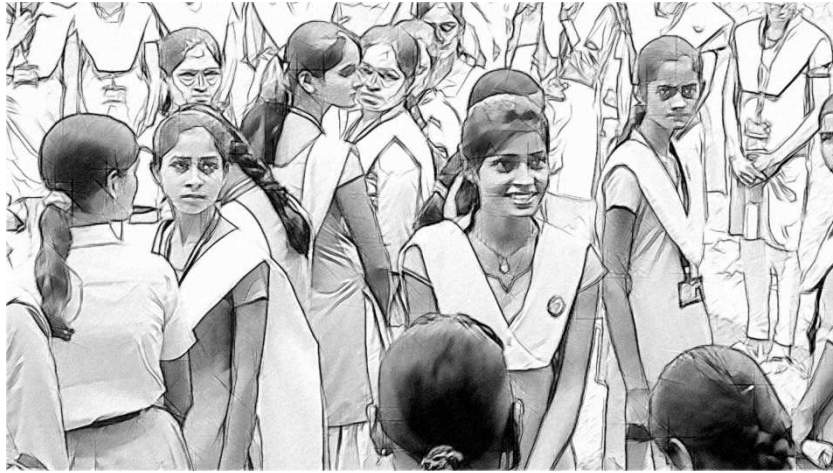
चित्र 2 कक्षा के बाहर 'व्यक्ति गणित'।

लगभग 20 विद्यार्थियों के समूह का उपयोग करें ताकि श्रेणियों में विभाजित करने के लिए पर्याप्त विद्यार्थी हों लेकिन इतने भी न हों कि आप जो चित्रित करना चाहते हैं वही धुंधला हो जाए।