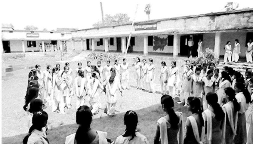
चित्र 1 कक्षा से बाहर गणित को मूर्त रूप देती हुई एक कक्षा।

आपके विद्यार्थियों को इस गतिविधि के लिए काफी स्थान की आवश्यकता होगी, अतः बाहर जाना या सभा कक्ष में जाना एक अच्छा विचार होगा (चित्र 1)।