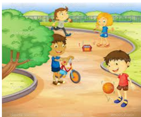
ଚିତ୍ର-୨ ଶିକ୍ଷାର୍ଥୀମାନଙ୍କ କଥୋପକଥନକୁ ସକ୍ରିୟ କରିବା ପାଇଁ ତିନୋଟି ଚିତ୍ର