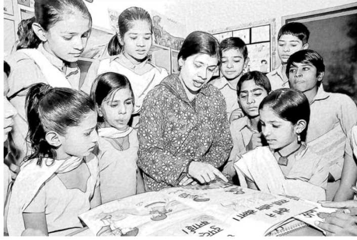
चित्र 1 कक्षा में एक पुस्तक के बारे में बात करना।

अपनी कक्षा में पुस्तक पर बात करने के लिए एक संक्षिप्त सत्र की योजना बनाएँ। यह 30 मिनट से ज्यादा समय की नहीं होनी चाहिए।