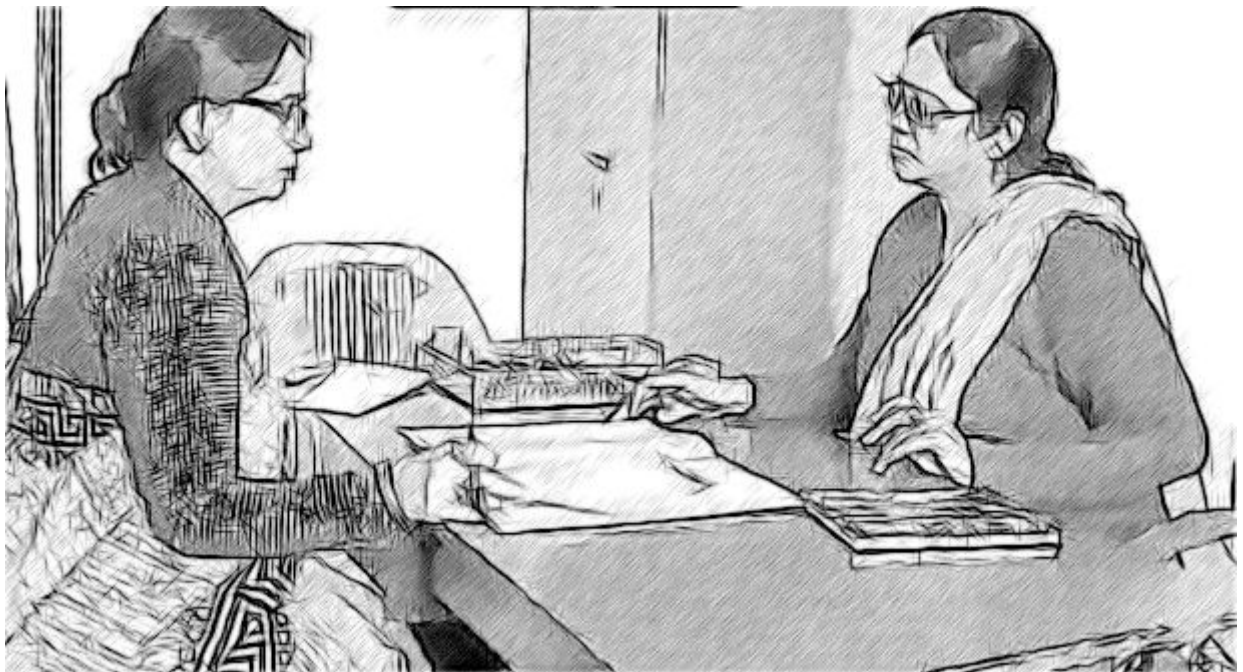
ଚିତ୍ର ୫ ଗୋଟିଏ ସଫଳ ବିଦ୍ୟାଳୟ ବିକାଶ ଯୋଜନା ସହଭାଗୀତା ଦରକାର କରେ ।