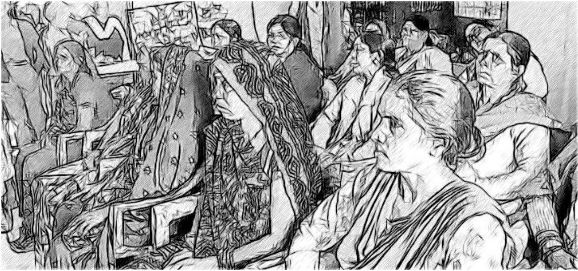
ଚିତ୍ର ୪ - ବିଦ୍ୟାଳୟ ପରିଚାଳନା କମିଟି ବୈଠକ