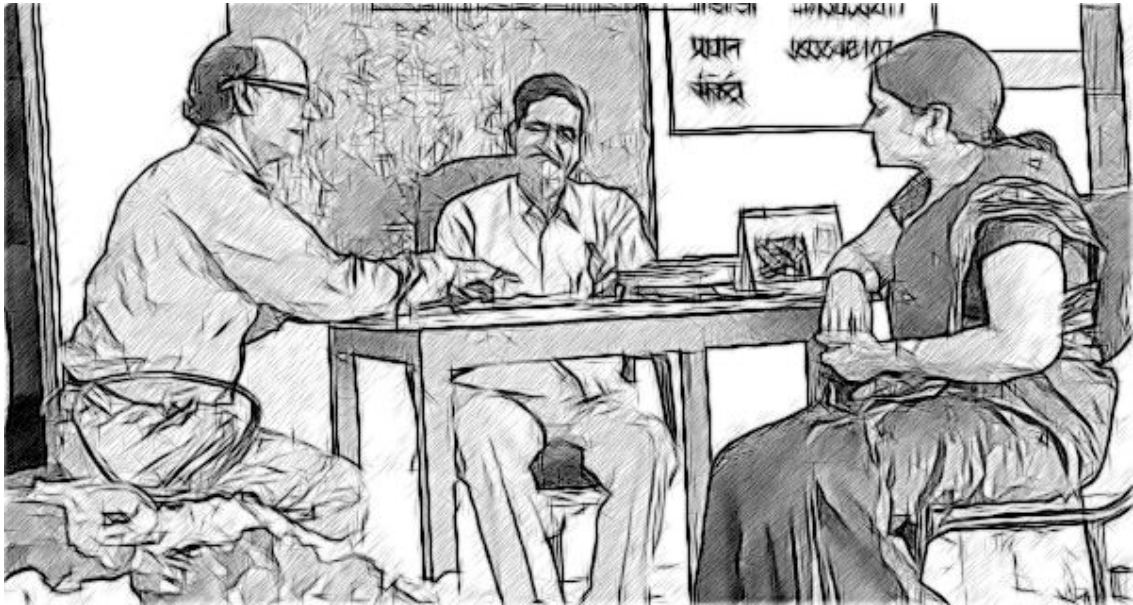
ଚିତ୍ର ୩ କାର୍ଯ୍ୟ ଦ୍ୱାରା ଲକ୍ଷ୍ୟ ହାସଲ ହୁଏ

ପ୍ରତିଟି କାମର ଦାୟିତ୍ୱ ନେବା ପାଇଁ ଆପଣ କାହାକୁ ବି ଚିହ୍ନଟ କରିବା ଉଚିତ୍ । କାମଗୁଡ଼ିକ ଯେପରି ନିର୍ଦ୍ଧାରିତ ସମୟରେ ସମାପନ ହେବ ସେଥିପାଇଁ ଆପଣ କାହାକୁ ବି ଦାୟିତ୍ୱ ଦେବା ଉଚିତ୍ । କାର୍ଯ୍ୟଗୁଡ଼ିକର ପ୍ରଗତିକୁ ତଦାରଖ କରିବା ପାଇଁ ଆପଣ କେତେକ ମାନଦଣ୍ଡକୁ ବ୍ୟବହାର କରିପାରିବେ । ଆପଣଙ୍କୁ ନିର୍ଦ୍ଦିଷ୍ଟ କରିବାରେ ଶିକ୍ଷଣକାର୍ଯ୍ୟ ୨ ସାହାଯ୍ୟ କରିବ । ଏହା ବହୁତ ସହଜରେ ଲେଖାଯାଇପାରିବ ଯେ, “ଝିଅଶିକ୍ଷାର୍ଥୀଙ୍କର ଉପସ୍ଥାନରେ ଉନ୍ନତି ଆଣିବା ଦରକାର ।” କିନ୍ତୁ କେହି ବି ଜଣେ ଯଦି ଏଥିପାଇଁ ପଦକ୍ଷେପ ନେବେ ନାହିଁ ତାହାହେଲେ କିଛି ହେବ ନାହିଁ ।