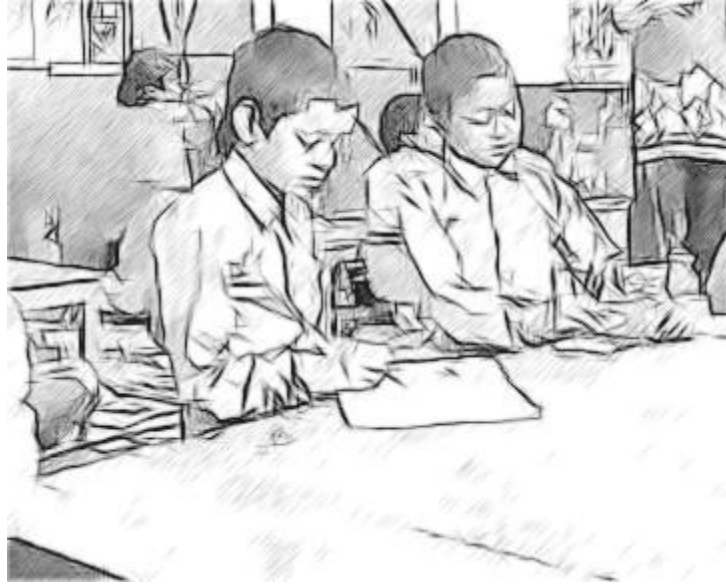
चित्र 3: पत्र लिखते हुए।

मेरे छात्र स्थानीय प्रशासन को एक विरोध पत्र लिखना चाहते थे। मैं इस कार्य में उनकी मदद करने के लिए सहमत हो गया। मैंने छह-छह छात्र-छात्राओं के समूह को एक कागज़ दिया और उनसे बाज़ार को स्थानांतरित करने के बारे में वे जो कहना चाहते थे, उसके मुख्य बिंदुओं को लिखने के लिए कहा।