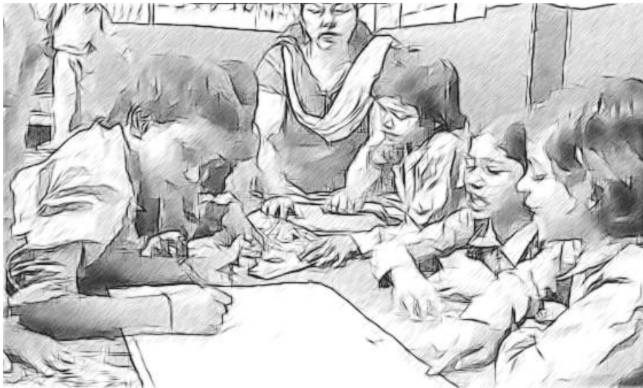
चित्र 2: एक कहानी पर मिलजुल कर काम करता एक समूह।

हर किसी के योगदान के बाद, मैं उनका कहा पढ़ कर सुनाते हुए शब्दों की ओर संकेत देती हूँ। फिर हम वाक्यों पर गौर करते हैं और उनकी एक सुसंगत कहानी बनाने के लिए उन्हें पुनर्व्यवस्थित करती हूँ। हम शब्दों और वाक्यांशों को जोड़ते हुए साथ मिल कर कहानी जोर से पढ़ते हैं ताकि प्रवाह बना रहे और वह और दिलचस्प हो सके। जब हर कोई कहानी से संतुष्ट हो जाए, हम एक उपयुक्त शीर्षक पर सहमत होते हैं।