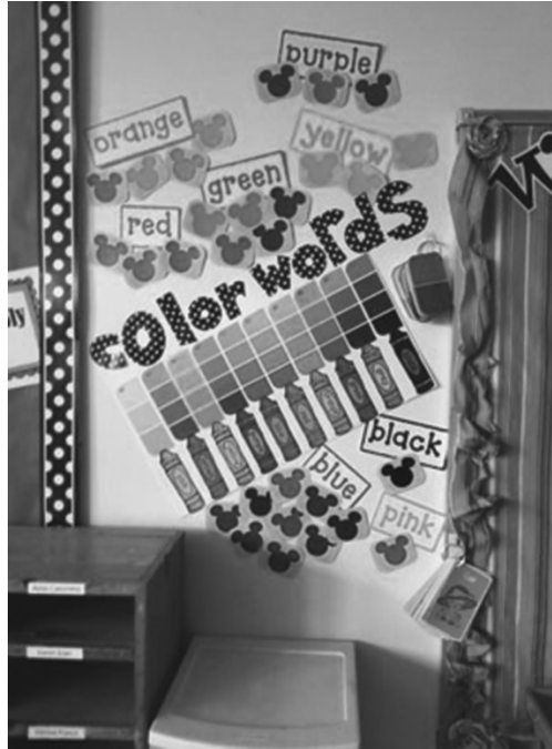
कला और शिल्प के पाठों में भाषा।

रचनात्मक कला के पाठ छात्रों के लिए उपयोगी होते हैं और उन्हें क्रियाशील बनाते हैं। इस सत्र में सीखी और उपयोग की जाने वाली भाषा अधिक समय तक याद रह सकती है। पहली केस स्टडी में, शिक्षिका इस बात पर ध्यान देती हैं कि छात्र सामान्यतः कला और शिल्प के पाठों में भाषा का उपयोग किस प्रकार करते हैं, और वे इन गतिविधियों में अंग्रेजी को शामिल करने का निर्णय करती हैं।