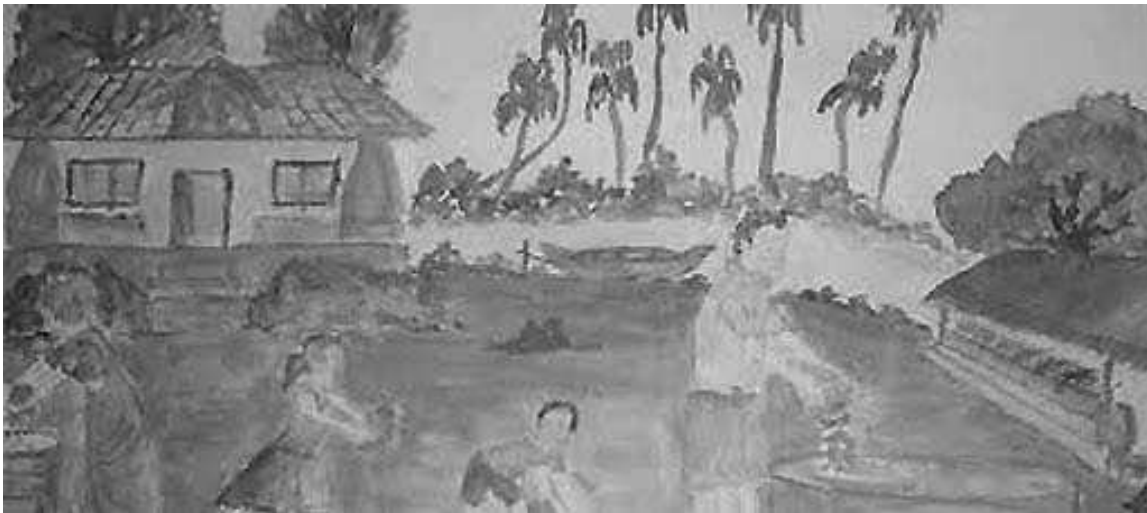
चित्र 1 कक्षा छ: के छात्र द्वारा बनाई गई पेंटिंग।

बॉक्स में दिए गए शब्दों के द्वारा परिच्छेद के खाली स्थान भरें।