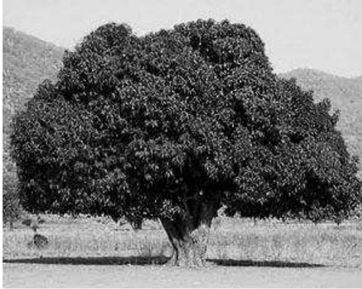
चित्र R2.1 एक आम का वृक्ष।