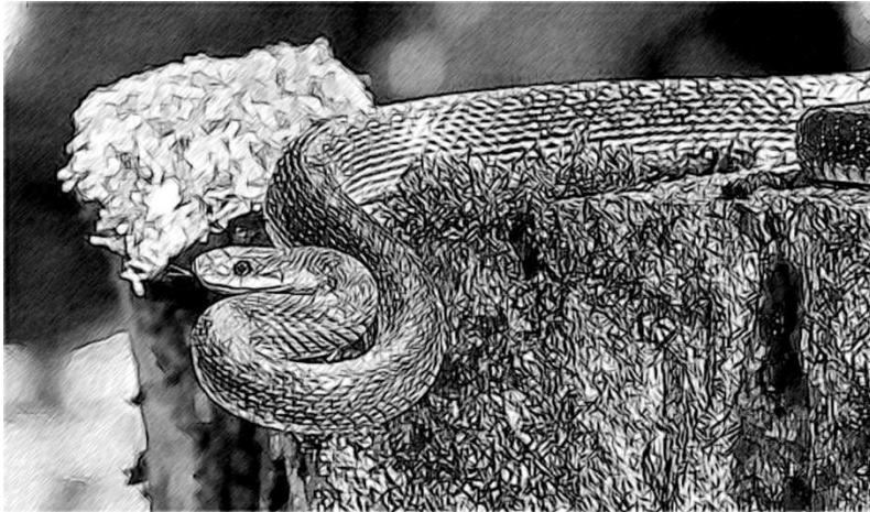
चित्र R5.1 एक रैट स्नेक।

एक रैट स्नेक धान के खेत के किनारे एक बिल में रहता था। रैट स्नेक खेत और गोदाम में आने वाले चूहों को खा जाता था। एक दिन सांप बहुत भूखा था और गोदाम में आये चूहे का पीछा कर रहा था। लेकिन चूहा बहुत चालाक था- वह तेजी से दौड़ा और गोदाम में जाकर छिप गया। सांप किसी दूसरे चूहे की तलाश में चला गया।