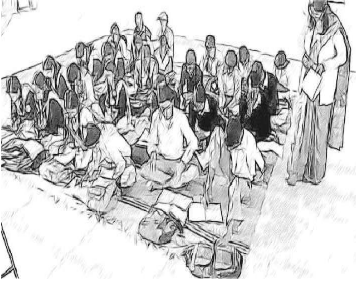
ଚିତ୍ର ୧ ସମଗ୍ର ଶ୍ରେଣୀ ତଦାରଖ କରିବା

ଆପଣଙ୍କ ଶିକ୍ଷାର୍ଥୀମାନଙ୍କୁ ସ୍ଵାଧୀନ ଓ ନିରବରେ କରିବାକୁ କିଛି ଶ୍ରେଣୀ କାର୍ଯ୍ୟ ଆନୁମାନିକ ୧୫ ମିନିଟ ପାଇଁ ଦିଅନ୍ତୁ । ଏଥିପାଇଁ ପାଠ୍ୟପୁସ୍ତକ ଆଧାରିତ ଗୋଟିଏ ଛୋଟ ପଠନ ବା ଲିଖନ କାର୍ଯ୍ୟ ଠିକ୍ ହେବ । ଆପଣଙ୍କ ଶିକ୍ଷାର୍ଥୀମାନେ କାର୍ଯ୍ୟ କରୁଥିବା ବେଳେ ପଛରେ ରହି ସେମାନଙ୍କ ପର୍ଯ୍ୟବେକ୍ଷଣ କରନ୍ତୁ । ଏହି ପରିପ୍ରେକ୍ଷାରେ ନିମ୍ନ ପ୍ରଶ୍ନଗୁଡ଼ିକୁ ବିଚାର କରନ୍ତୁ ।