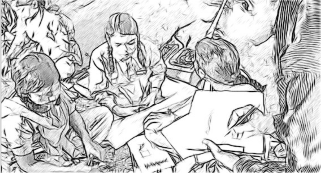
ଚିତ୍ର ୨ ତଦାରଖ ଦଳ

ଆପଣଙ୍କ ଶ୍ରେଣୀକୁ ପାଞ୍ଚ ବା ଛଅ ଦଳରେ ଭାଗ କରନ୍ତୁ। ସେମାନଙ୍କୁ ଗୋଟିଏ ଛୋଟ କଥନ ଭିତ୍ତିକ କାର୍ଯ୍ୟ କରିବାକୁ କୁହନ୍ତୁ। ଏଥିରେ ଗୋଟିଏ ଗପ ତିଆରି କରିବା ସହିତ ଛବି ଯୋଡ଼ାଯାଇପାରେ ବା ଏକ ସମସ୍ୟା ପ୍ରତି ପ୍ରତିକ୍ରିୟା ପ୍ରକାଶ କରିବା ବା ଏକ ବାଦାନ୍ତୁବାଦ ମୂଳକ ପ୍ରଶ୍ନ ପ୍ରତି ପ୍ରତିକ୍ରିୟାଶୀଳ ହେବା ହୋଇପାରେ। ଦଳଗତ ଆଲୋଚନା ୧୫ ମିନିଟରୁ ଅଧିକ ହେବା ଉଚିତ ନୁହେଁ। ଆପଣଙ୍କ ଶିକ୍ଷାର୍ଥୀମାନଙ୍କୁ କିପରି ଶାନ୍ତ ଭାବରେ ଏକତ୍ର କାର୍ଯ୍ୟ କରାଯାଇପାରେ ମନେପକାଇ ଦିଅନ୍ତୁ। ଏଥି ସହିତ ପାଳି କରି ଆଲୋଚନା ଓ କଥାହେବା ଓ ପରସ୍ପରର ଅବଦାନକୁ ଶୁଣିବା। ଶ୍ରେଣୀର ଚାରିଆଡ଼େ ବୁଲନ୍ତୁ ଓ ଆପଣଙ୍କ ଶିକ୍ଷାର୍ଥୀମାନେ କହୁଥିବା ବେଳେ ପର୍ଯ୍ୟବେକ୍ଷଣ କରନ୍ତୁ ଓ ଶୁଣନ୍ତୁ।