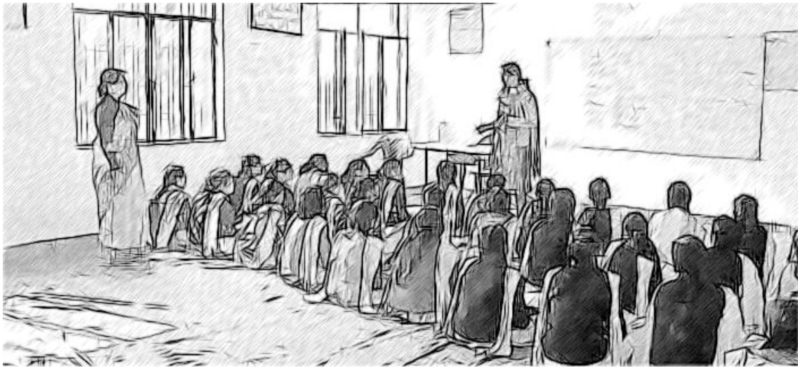
चित्र 4 सुधार के क्षेत्रों की पहचान करने के लिए अपनी टीम के साथ काम करें।

जो विद्यालय अपनी कल्पना को साकार करने की ओर की जा रही गतिविधि का आकलन करना चाहते हैं वे प्रतिक्रिया प्रदान करने का वातावरण बनाते हैं। यदि आपने देखा है कि आपका विद्यालय शिक्षकों के लिए अपने अध्यापन में सुधार करने की एक अच्छी जगह है, तो यह पता करने का यह अच्छा समय है कि क्या आपके शेष शिक्षक भी यही बात कहेंगे। यह मालूम करना भी महत्वपूर्ण होगा कि क्या आपके छात्र इसका ऐसी जगह के रूप में वर्णन करेंगे जहाँ वे इसलिए आना चाहते हैं क्योंकि वे वह सीखते हैं जो वे जानना चाहते हैं और आश्वस्त महसूस करते हैं, और क्या मातापिता अपने बच्चों के सीखने के ढंग से सहमत होंगे या नहीं। अगली गतिविधि आपको कई हितधारकों के दृष्टिकोण समझने में मदद करेगी।