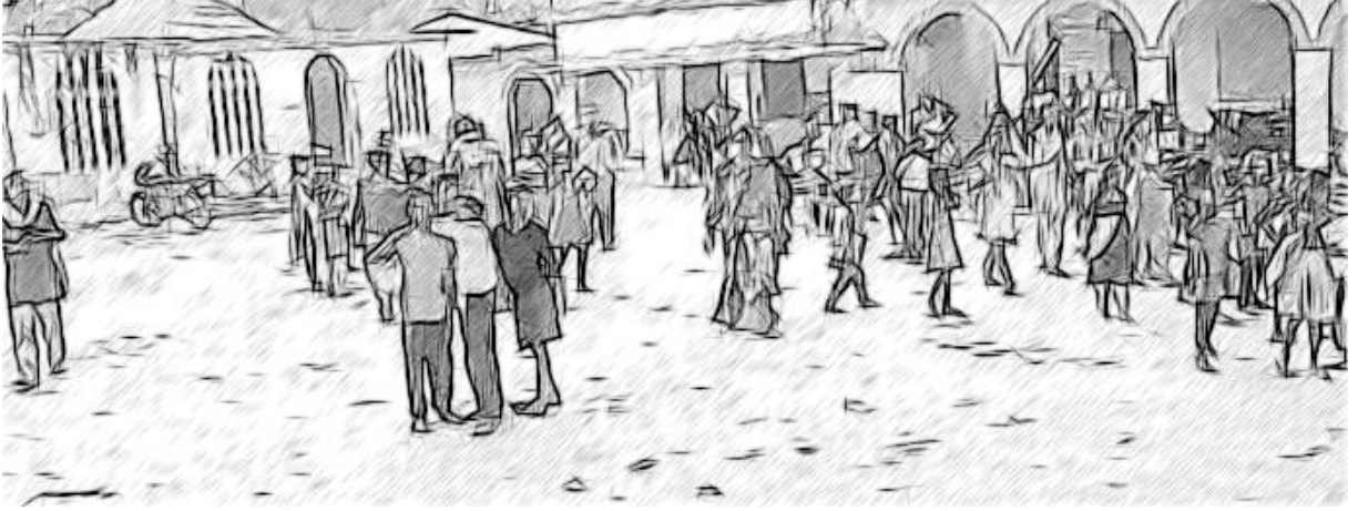
चित्र 1 विद्यालय की संस्कृति सीखने की प्रक्रिया को प्रभावित कर सकती है।