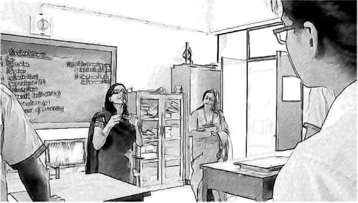
चित्र 3 एक कार्य- और संबंधोन्मुख विद्यालय नेतृत्व।

यदि आपको लगता है कि आप ऐसा करने में सक्षम हैं तो अन्य लोगों से इस बारे में प्रतिक्रिया देने के लिए कहना बहुत उपयोगी होता है कि उन्होंने आपके नेतृत्व को किस तरह से महसूस किया है, क्योंकि अन्यथा आप इसका केवल अनुमान ही लगा सकते हैं। इसके लिए काफी आत्मविश्वास की जरूरत पड़ सकती है, और आप उपरोक्त गतिविधि को स्टाफ के किसी ऐसे सदस्य के साथ साझा करना तय करके शुरू कर सकते हैं जिस पर आपको लगता है कि आप ईमानदार, निष्पक्ष और मददगार राय देने का भरोसा कर सकते हैं।