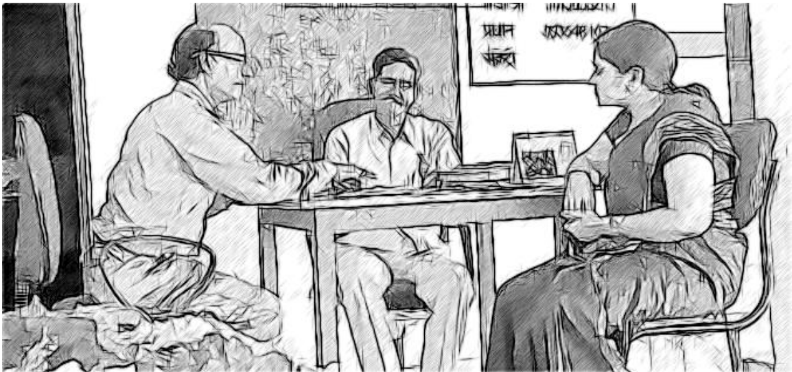
चित्र 5 सकारात्मक विद्यालय संस्कृति के लिए कार्यवाही योजना की जरूरत पड़ती है।

आपने अपने विद्यालय की मौजूदा संस्कृति के बारे में अब काफी मात्रा में प्रमाण एकत्र कर लिया है। इसमें विद्यालय संस्कृति के बारे में आपके अपने विचार (गतिविधि 1-3), विद्यालय के इर्दगिर्द व्यवहारों और कार्यवाहियों के प्रेक्षण (गतिविधि 4), जिस टीम के साथ आप काम करते रहे हैं उसके परिप्रेक्ष्य (गतिविधि 5), और अन्य हितधारकों के दृष्टिकोण (गतिविधि 6) शामिल होंगे।