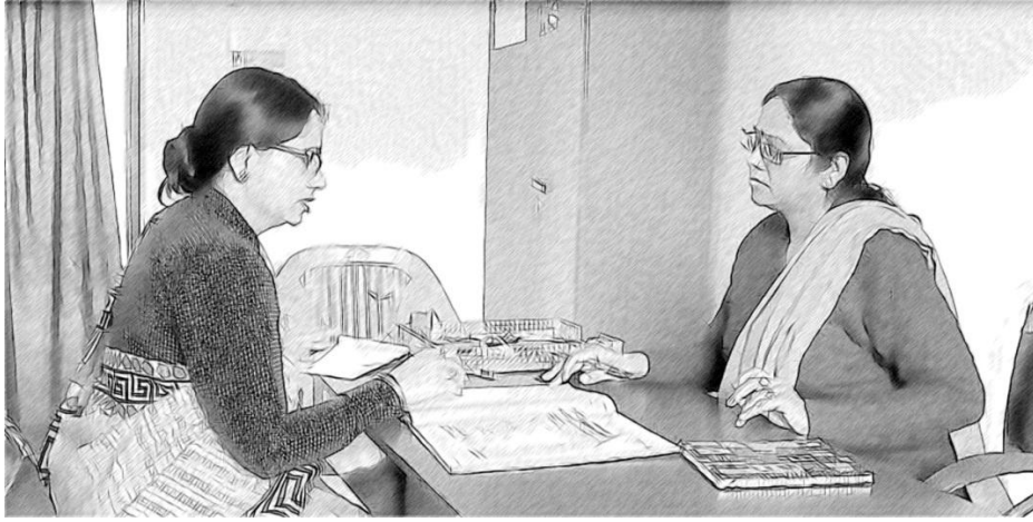
चित्र 2 आपके शिक्षक आपके पेशेवर विकास के उदाहरण का अनुगमन करेंगे।

आपके स्वयं के अध्ययन के प्रति आपका रवैया, आपके शिक्षकों के उनके पेशेवर विकास के प्रति रवैये को प्रत्यक्ष तौर पर प्रभावित करेगा। कौशलों में आपकी वृद्धि तथा परिवर्तन के लिए आपकी तत्परता उन्हें बदलने तथा स्वयं की वृद्धि करने के लिए प्रोत्साहित करेगी। आपके सबसे बहुमूल्य संसाधन आपके शिक्षक हैं, तथा आपको उन्हें उनकी क्षमता के अनुरूप सर्वोत्तम शिक्षक बनने के लिए अवसर प्रदान करने की आवश्यकता है। आपको यह अपेक्षा एवं आशा करने की आवश्यकता है कि वे आपसे बेहतर शिक्षक बनेंगे!