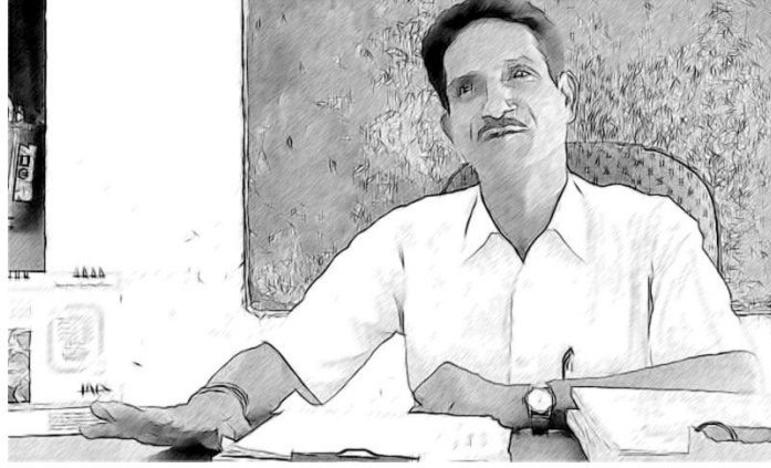
चित्र 1 एक नेता के रूप में अपने व्यावसायिक विकास पर विचार करना।