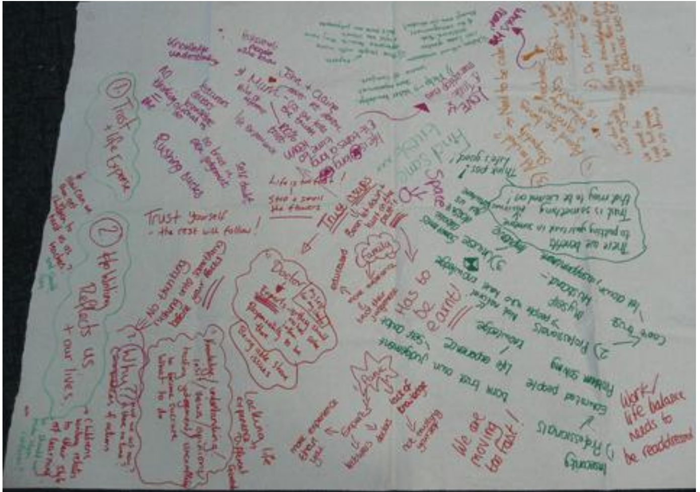
चित्र 7 अपने अध्यापकों के विचारों का संग्रह करना।

अगर आपका स्टाफ समूह बड़ा है, तो आप अलग अलग दीवारों पर अलग अलग विषय लिख सकते हैं और स्टाफ से कह सकते हैं कि वे दीवार तक जाएं और कागज की शीटों पर अपनी टिप्पणियां लिखें और फिर प्रत्येक शीट पर साथ मिलकर चर्चा करें। अगर आपके पास चिपकाने वाली नोट्स की पर्चियां हों तो आप अपने स्टाफ से उन पर लिख कर उन्हें कागज की उपयुक्त शीट पर चिपकाने को कह सकते हैं। एक अन्य विकल्प के तौर पर, आप कागजी मेजपोश का इस्तेमाल कर सकते हैं और स्टाफ से कह सकते हैं कि वे एक-एक करके मेजों पर जाते रहें और समूह के रूप में बैठ कर उस पर लिखते जाएं।