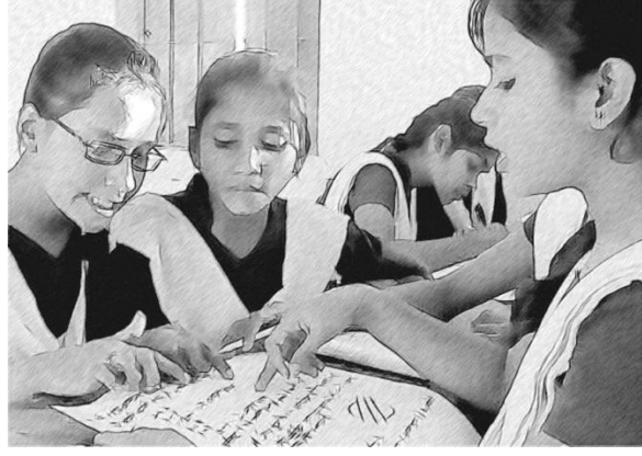
चित्र 3 आपको अपने विद्यालय में क्या सुधार करना है?

उदाहरण के लिए, आप जानते हैं कि आपके शिक्षक कक्षाओं में जाने से पहले अपने पाठों के बारे में पर्याप्त रूप से नहीं सोचते हैं। तो इसके लिए आप पाठों की योजना बनाने पर ध्यान देने का चुनाव कर सकते हैं। इससे न केवल पाठों को संरचित करने के तरीके में, बल्कि प्रयुक्त शिक्षण विधियों और संसाधनों की विविधता में भी सुधार संभव हो सकते हैं। वैकल्पिक तौर पर, हो सकता है कि आप चाहते हों कि विद्यार्थी थोड़ा अधिक बोलें ('सीखने के लिए बोलना' मुख्य संसाधन देखें), या हो सकता है कि आपके विद्यालय में बड़ी कक्षाएं हों और आप यह तय करें कि शिक्षकों के लिए बड़ी कक्षाओं को प्रभावी ढंग से पढ़ाना आसान बनाने के लिए विद्यार्थियों से जोड़ियों में कार्य करवाया जाए ('जोड़ी में कार्य का उपयोग करना')।