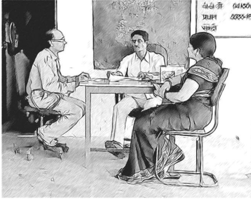
चित्र 4 विद्यालय नेता को अपने शिक्षकों को संलग्न करना चाहिए।

अपने अधीनस्थ-अधिकारी या किसी अन्य वरिष्ठ शिक्षण के साथ काम करते हुए, अपने विद्यालय के शिक्षण और सीखने की क्रिया में सुधार लाने पर फोकस करने का अपना विचार साझा करें। उपलब्ध TESS-India ओईआर को विस्तार से देखें। याद रखें, गतिविधियों को अन्य विषय क्षेत्रों के लिए आसानी से ढाला जा सकता है, और संभवतः आपको यही करने की आवश्यकता पड़ेगी। पर सबसे पहले आपको टीईएसएस-इंडिया ओईआर और उनकी पद्धति से परिचित हो जाना चाहिए।