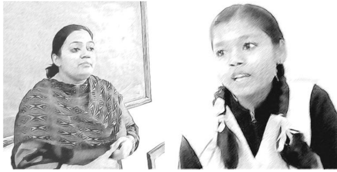
चित्र 1 छात्रों की भागीदारी से सीखने की क्रिया बेहतर बनेगी; शिक्षक भी शिक्षार्थी होते हैं।

शोध इस बात पर सहमत है। वास्तविकता यह है कि इसका क्रियान्वयन कठिन है। कई शिक्षक, विशेष रूप से माध्यमिक स्तर के शिक्षक, यह मानते हैं कि कक्षा का आकार बड़ा होना और परीक्षा पाठ्यक्रम जैसे कारण उन्हें अधिक विद्यार्थी-केंद्रित पद्धतियां अपनाने में सक्षम नहीं बनने देते हैं। टीईएसएस-इंडिया ओईआर वृत्त अध्ययनों (case studies) और गतिविधियों (activities) के रूप में क्रियात्मक उदाहरण प्रदान करते हैं जिन्हें शिक्षक अपनी कक्षाओं में लागू करके इन चिंताओं से मुक्ति पा सकते हैं।