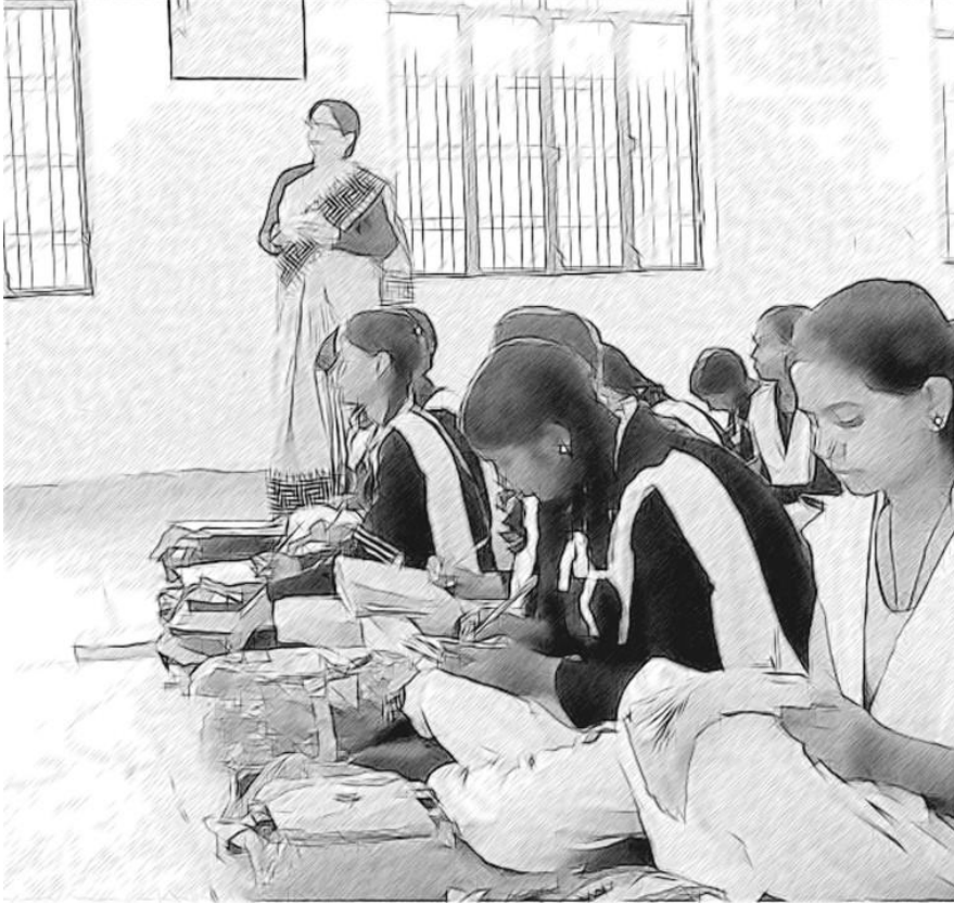
चित्र 5 शिक्षकों द्वारा अपने कार्याभ्यास को विकसित करने से कक्षा में परिवर्तन आते हैं।

मैं यह जानने को बहुत उत्सुक थी कि शिक्षक अपनी कार्यप्रथाएं किस प्रकार विकसित करेंगे और टीईएसएस-इंडिया ओईआर का इस्तेमाल कैसे करेंगे। मैंने शिक्षकों को प्रोत्साहित किया कि वे अपने अनुभवों के बारे में मुझसे और दूसरों से बात करें। इससे मुझे थोड़ी अंदरूनी जानकारी मिली कि शिक्षकों में क्या चला रहा है। अब मैं जब भी कभी विद्यालय में टहलती हूँ, तो यह सुनने की कोशिश करती हूँ कि कक्षाओं में किस बारे में बात की जा रही है और बात कौन कर रहा है।