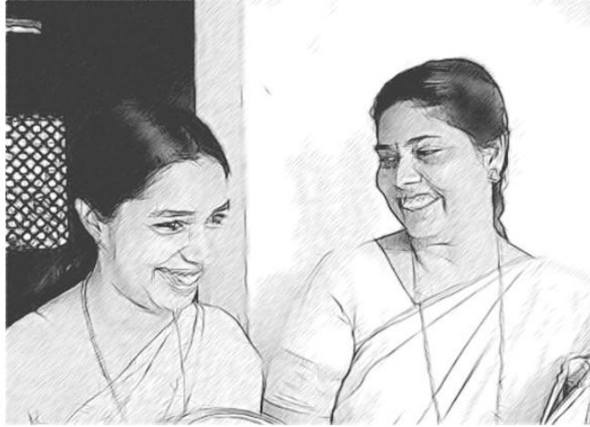
चित्र 6 आपको अपने कार्य की खुशी मनानी चाहिए और उसे प्रदर्शित करना चाहिए।

अपने सत्र के अंत में आप खुशी मनाने के लिए और शिक्षण एवं सीखने में फोकस मुद्दे पर किए गए कठिन कार्य करने के प्रति आभार प्रकट करने के लिए एक बैठक आयोजित कर सकते हैं। इसकी तैयारी के लिए आप चाहें तो अपनी सीखने की ज़ायरी पर फिर से नजर डाल कर खुद को यह याद दिला सकते हैं कि आपने शुरुआत कहां से की थी। इस बैठक को मात्र औपचारिक नहीं बल्कि अन्यान्य क्रियात्मक और भागीदारी से पूर्ण होना चाहिए।