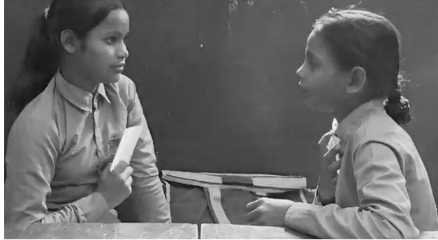
ಚಿತ್ರ 2 ತರಗತಿಯಲ್ಲಿ ಜೋಡಿಕಾರ್ಯ

ಮಾರನೆಯ ದಿನ ನನ್ನ ವಿದ್ಯಾರ್ಥಿಗಳನ್ನು ಜೋಡಿಯಲ್ಲಿ (Pair) ಕುಳಿತುಕೊಳ್ಳುವಂತೆ ವ್ಯವಸ್ಥೆ ಮಾಡಿ, ತಮ್ಮ ಮನೆ ಕೆಲಸವನ್ನು ಪರಸ್ಪರ ಚರ್ಚಿಸುವಂತೆ ತಿಳಿಸಿದೆ. ನಂತರ ಇಡೀ ತರಗತಿ ಚರ್ಚೆಗೆ ಅವಕಾಶ ಕೊಟ್ಟು, ಈವರೆಗೆ ಮಾತನಾಡದೇ ಇದ್ದ ವಿದ್ಯಾರ್ಥಿಗಳಿಗೆ ಅವಕಾಶ ಸಿಗುವಂತೆ ಗಮನಹರಿಸಿದೆ.